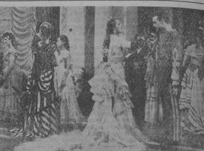
La compañía del Scala de Berlín, en el Cómico. El próximo viernes se presentará en el Cómico...