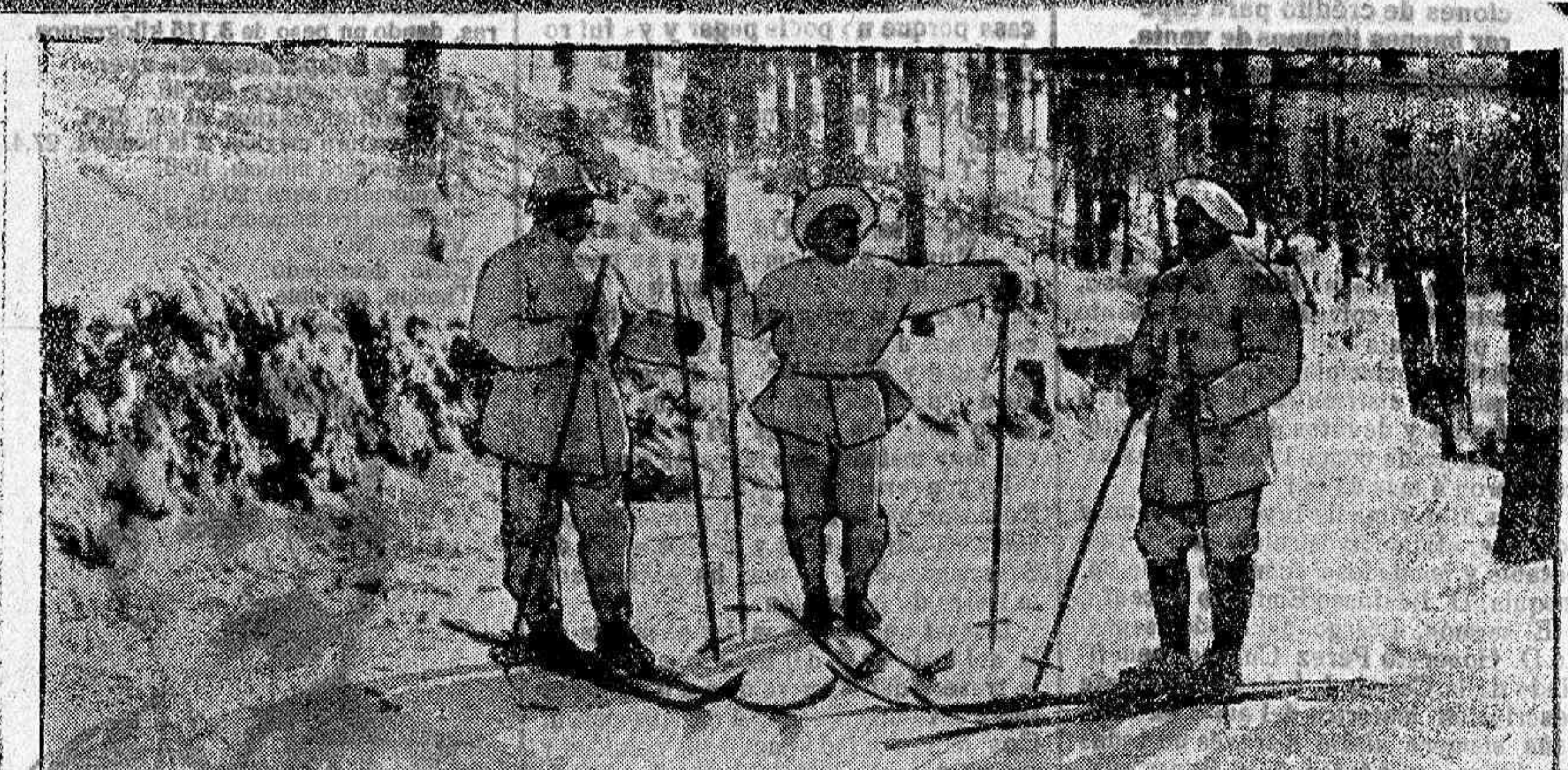
Notas gráficas de la guerra. — Alpinos franceses en los Alpes.

—España despierta, políticos de mi patria! Despierta con la conciencia de su moderna pasada, con la intuición de las punaladas aseradas en su destino por los cuadrillos egoístas, con el asombro de permanecer estancada todavía en la época luctuosa de Fernando VII. Y quiere marchar. Y marchará rompiendo los obstáculos, despedazando los intereses consolidados a la sombra de los desenfados, porque todavía alienta en su organismo el anhelo de la grandeza y de la gloria. ¡Os engañasteis, señores políticos!