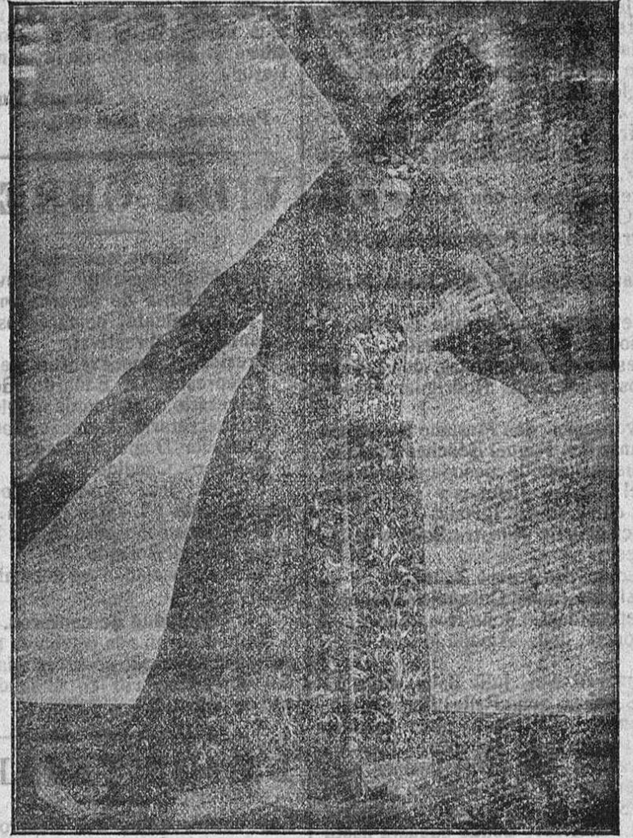
Imagen de Jesús Nazareno.

Es este acto el más importante seguramente que se celebra en la Semana Santa y que atrae gran número de fo-