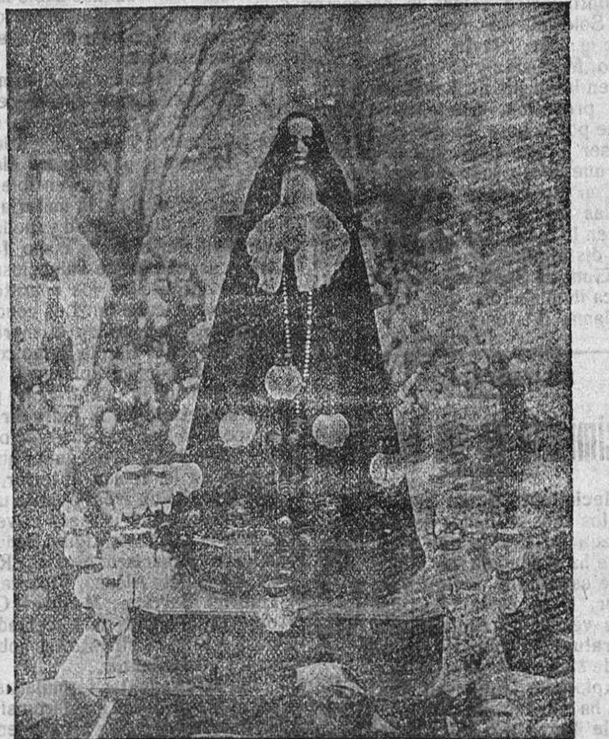
Imagen de la Soledad, cuya procesión se celebra á las once de la noche.

En ella serán llevados los pasos de la Oración del Huerto, los Azotes, la Caña, la Calda, el llamado de San Ju-