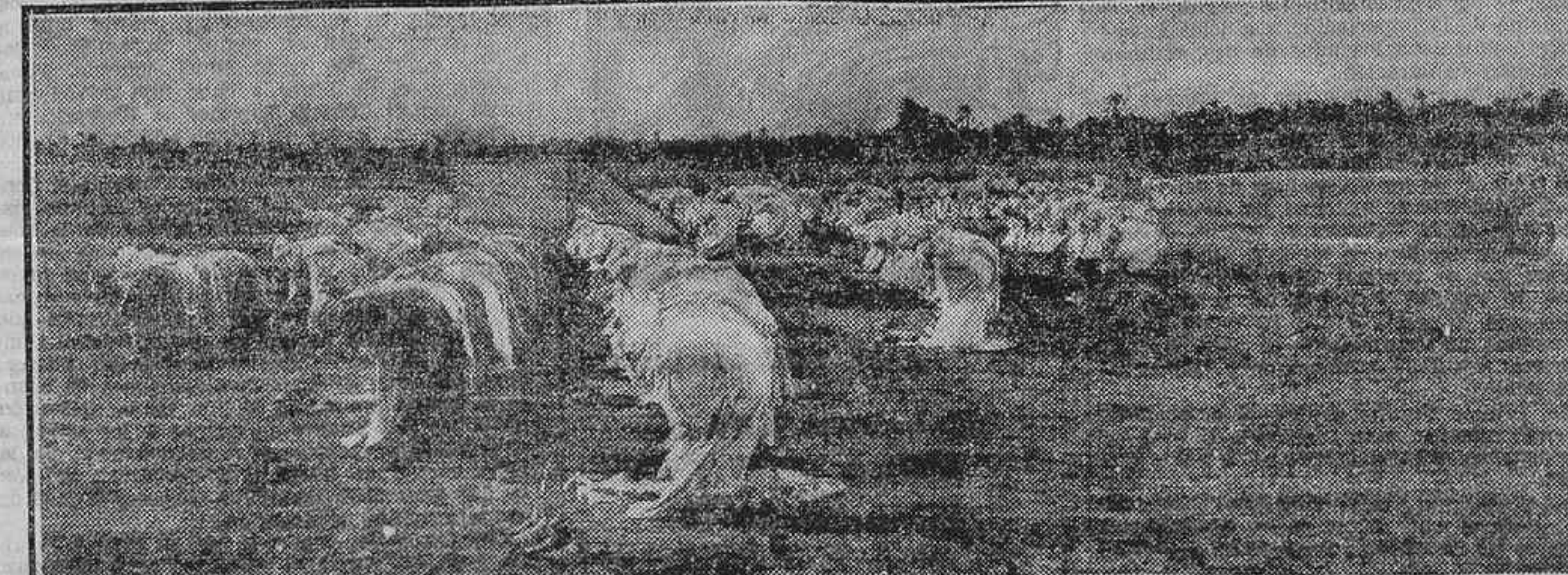
ESCENAS AFRICANAS.—LA ORACION DE LA TARDE

XI. Principales factores sociales que influyen