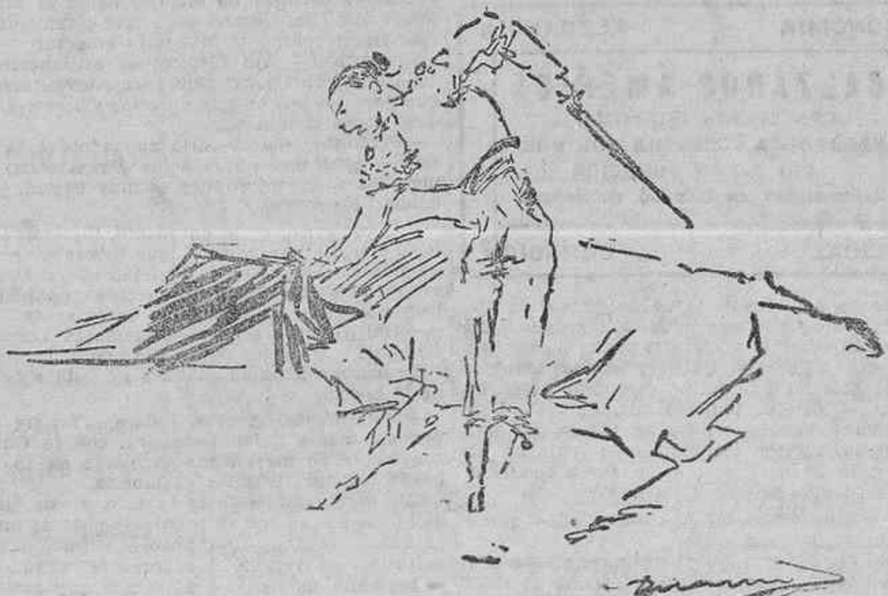
UN NATURAL DE POSADA

Primera carrera.—Premio «Consul» (a reclamari); 2.000 pesetas al primero y la mitad del