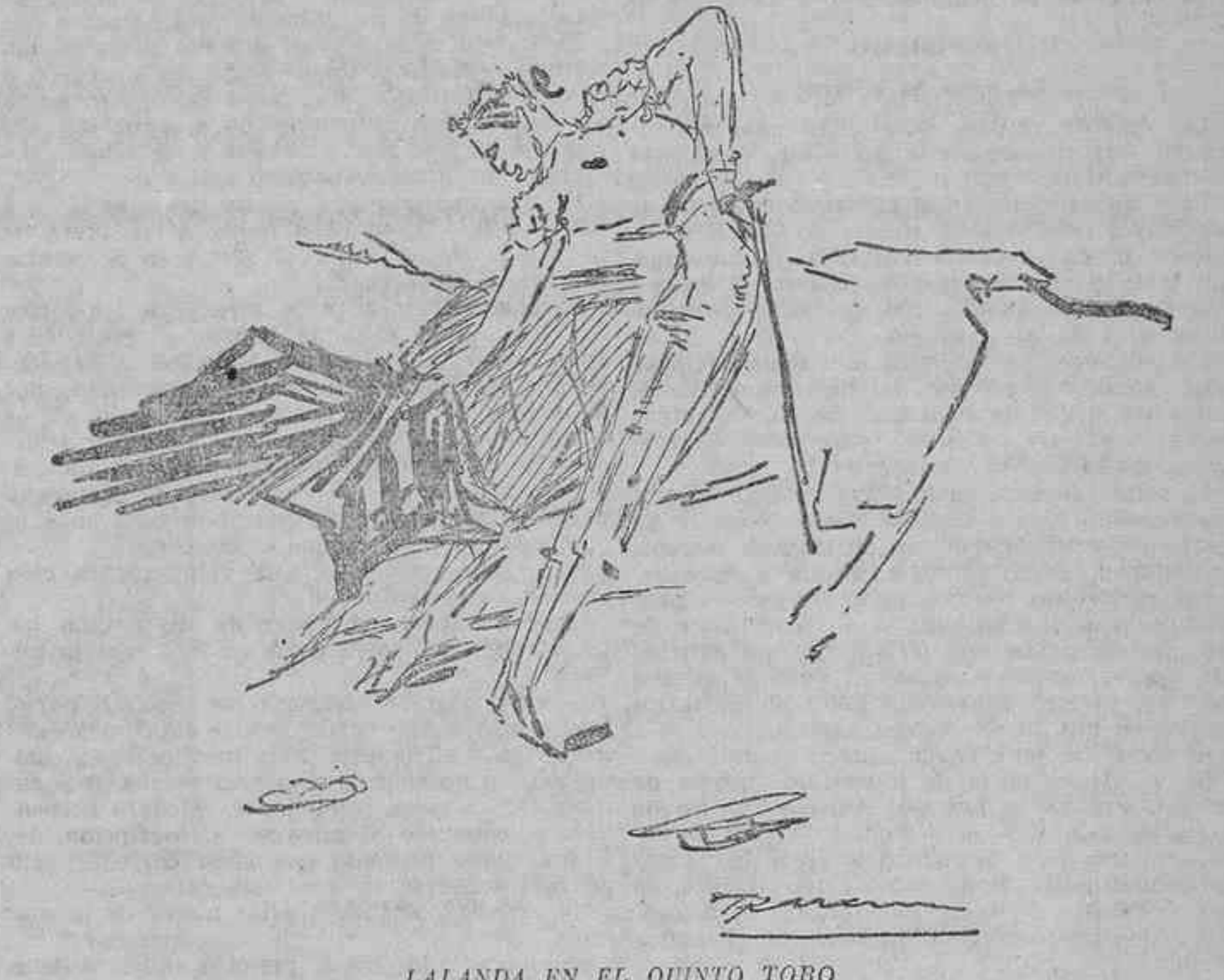
LALANDA EN EL QUINTO TORO