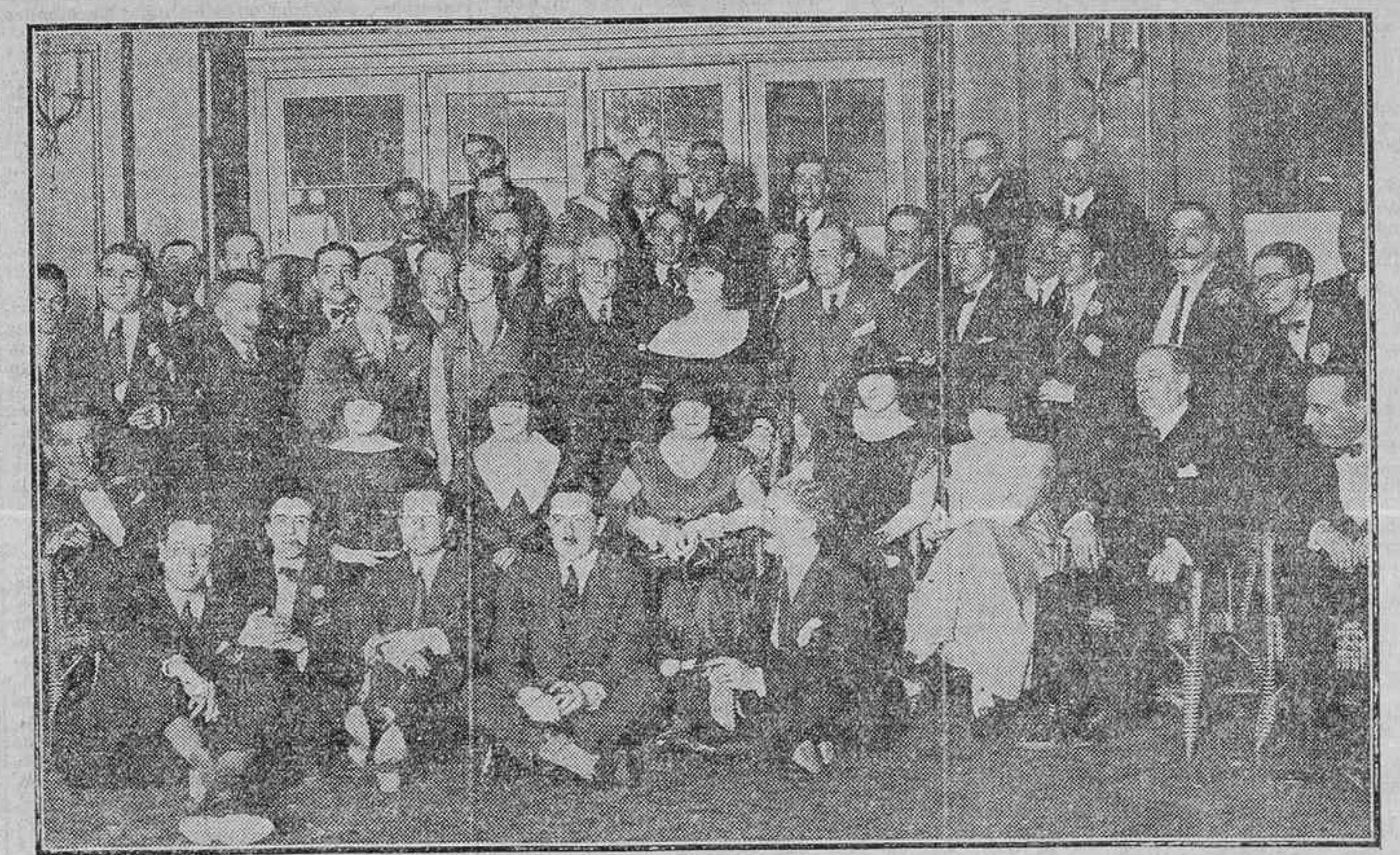
GRUPO DE ASISTENTES AL BANQUETE CELEBRADO AYER EN HONOR DE MENÉSES Y LEZAMA