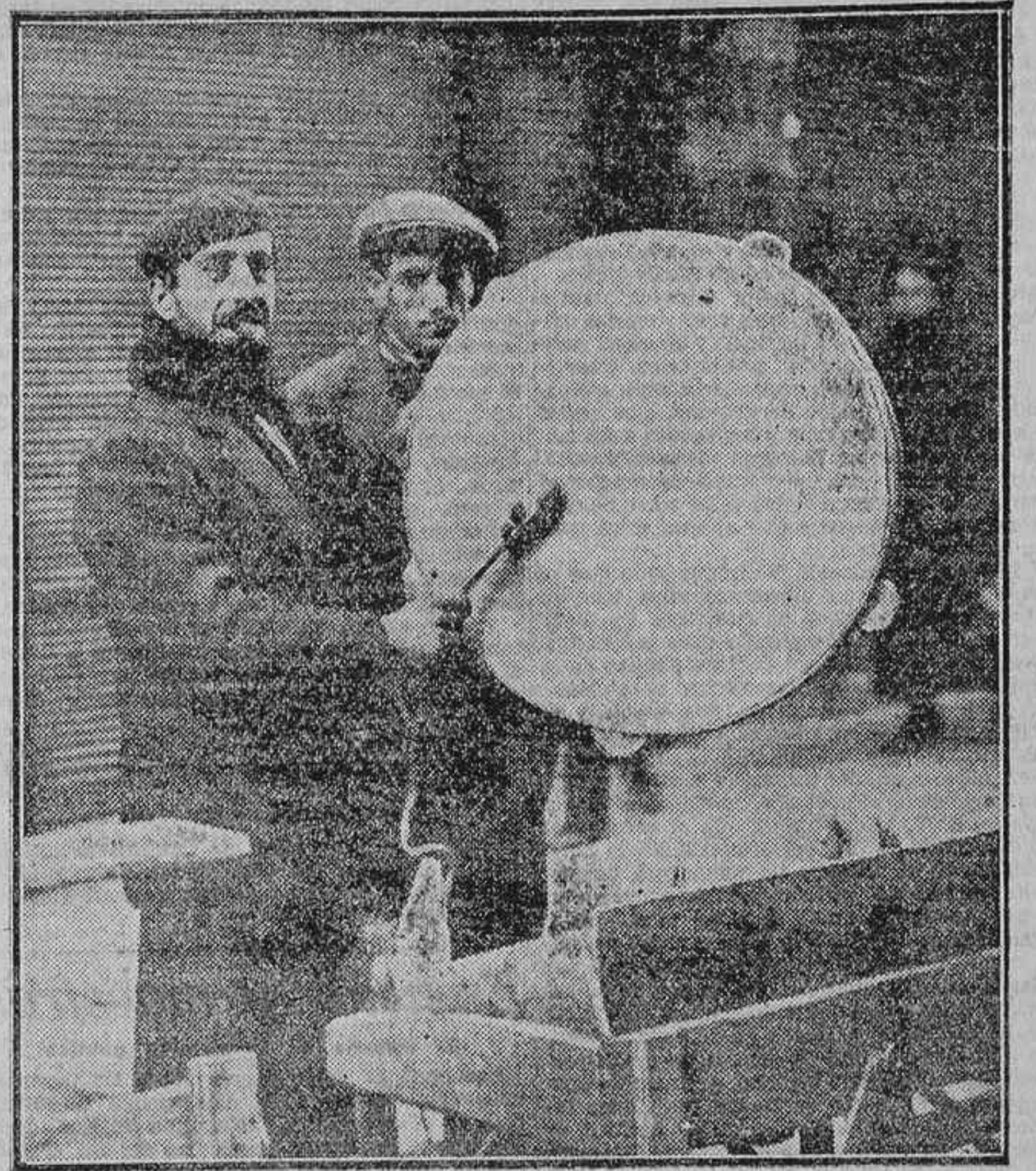
EL VENDEDOR DE PANDEROS