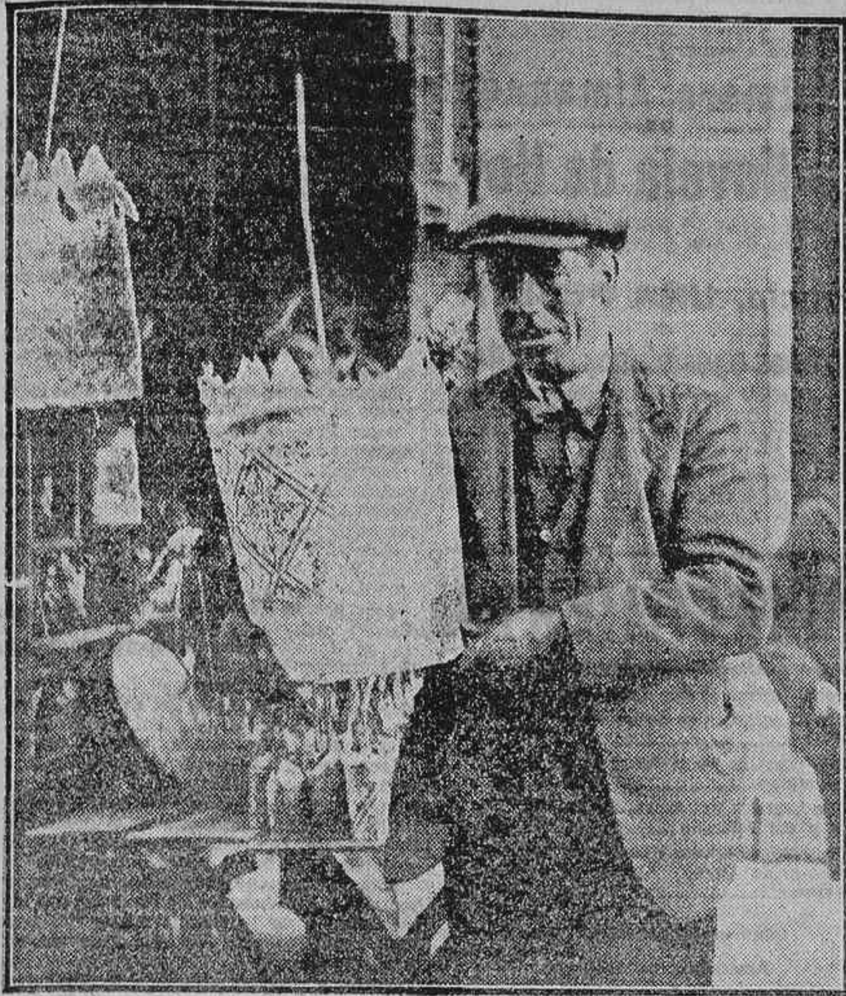
EL TIO DE LAS ZAMBOMBAS