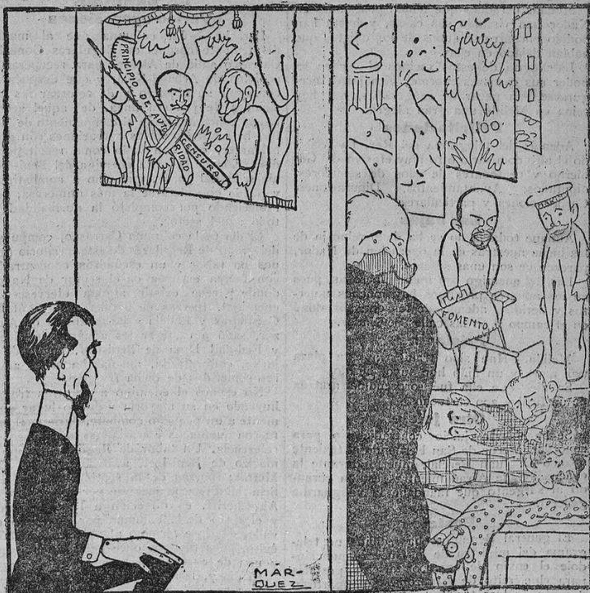
Cambó: Esto es una comedia de «astrakán»... Lo que es este empresario no me saca más dinero. Antes me pongo la barretina y me voy a mi casa..