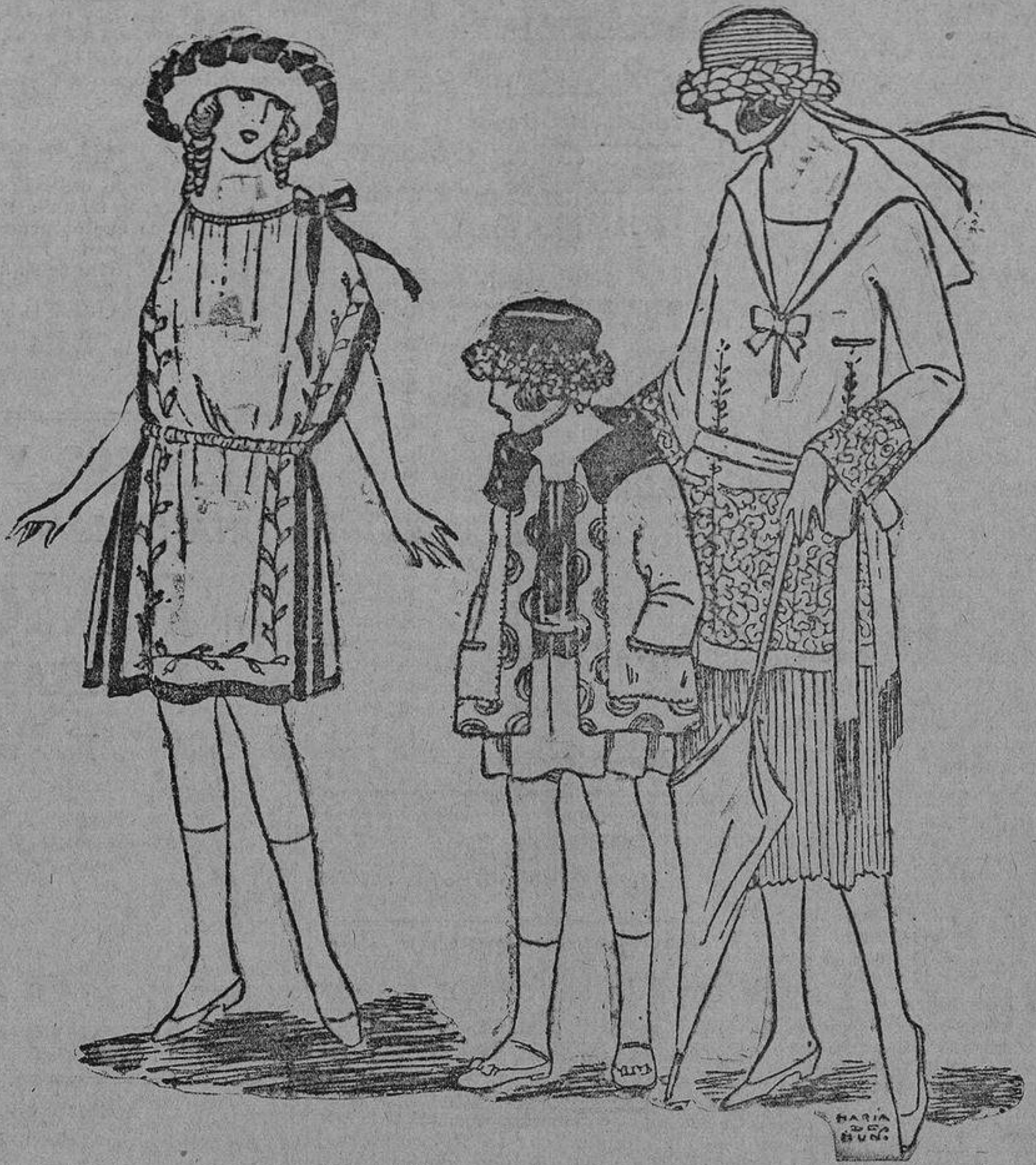
Sencillo vestido de crepón de seda blanco; bordados y tiras de seda verde jade.

Las flores de lino se emplean también para perfumar la ropa y no solamente perfuman, sino que tiene el poder de alejar las polillas, mariposillas y demás destructores.