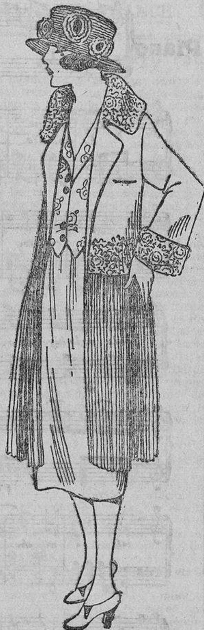
Hace frío en estas playas norteañas; por eso es imprescindible uno de estos abrigos, que bien pueden ser como éste, de fina gabardina «beige» bordada tono sobre tono.

nía poco después. ¡Oh, qué impertinentes!