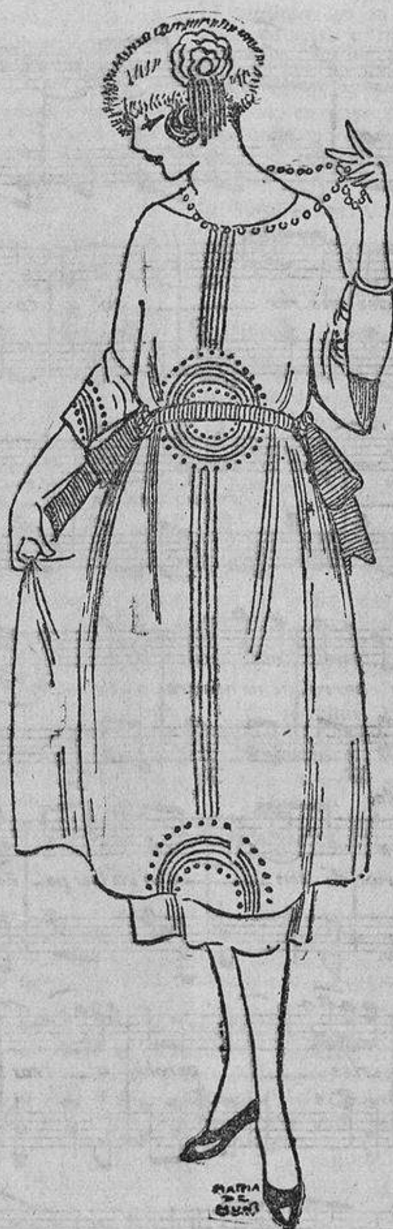
¿Una fantasa ultra chic? Border con perlas de azabache y colocar tiras muy estrechas de esa especie de charol brillante, sobre la nitidez de un organdí blanco.