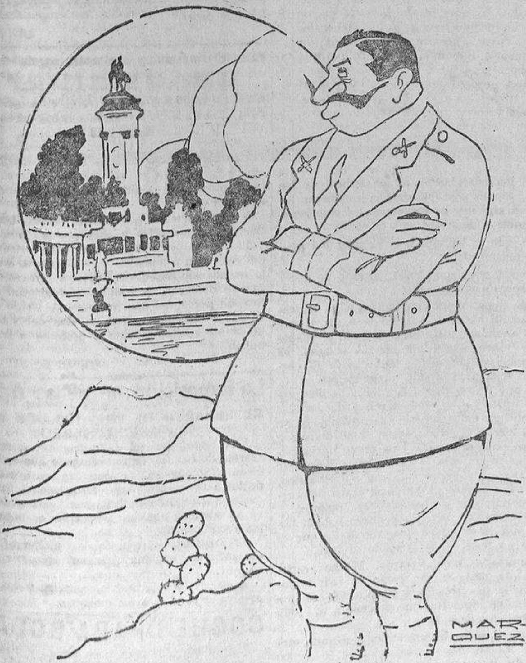
—¡Aqué! sí que fué un pacificador...