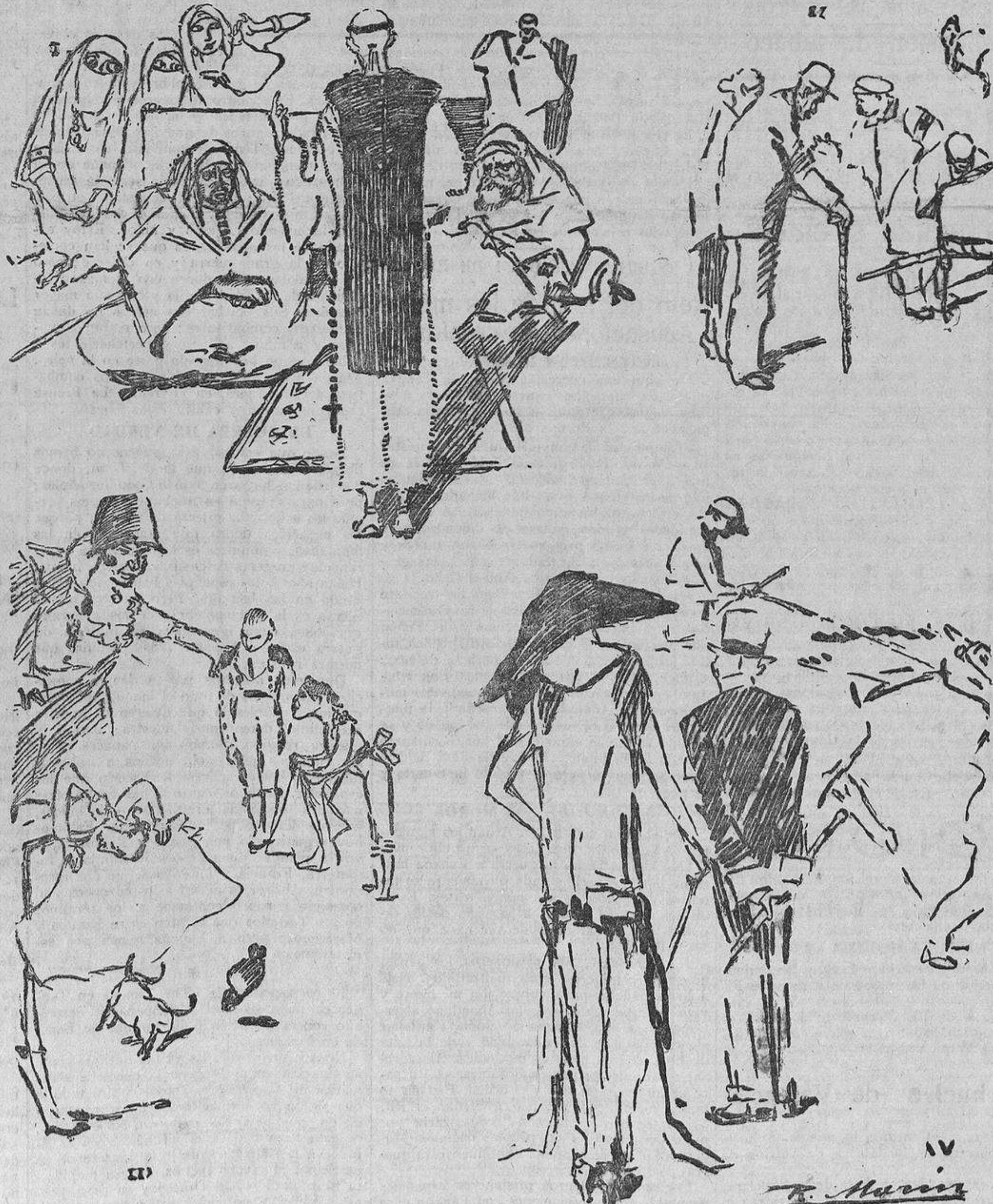
I. Moros y cristianos o las tentaciones del padre Revilla.—II. Camillero I. El uno viene sacramentado y el otro herido gravemente. ¿En qué toro ha sido? Camillero II. En la tercera carrera de caballos de la tarde. — III. Pepe-Hillo (a los toreros que tomaron parte en la corrida del Montepío): «Tú, Chicuelín, esencia del torero ¡con ese miedo!, córtate la coleta ya. Marcial: Si todo tu arte está en el dolantal, a la cocina a escape. Y tú, Nacional II, menos túnel trágico y a no torear a cabeza pasada.» IV. Bonita carrera. Por correr unos minutos se premia con 50.000 pesetas a un caballo. ¿Conoces tú algún premio de esa cuantía para recompensar en una carrera a la inteligencia y al trabajo?