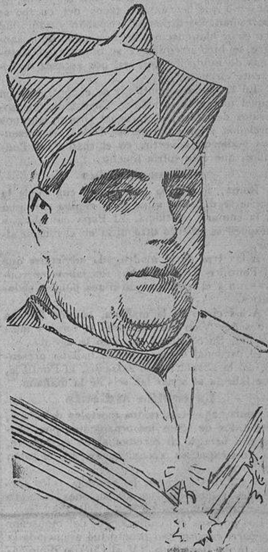
SU EMINENCIA EL CARDENAL ALMARAZ