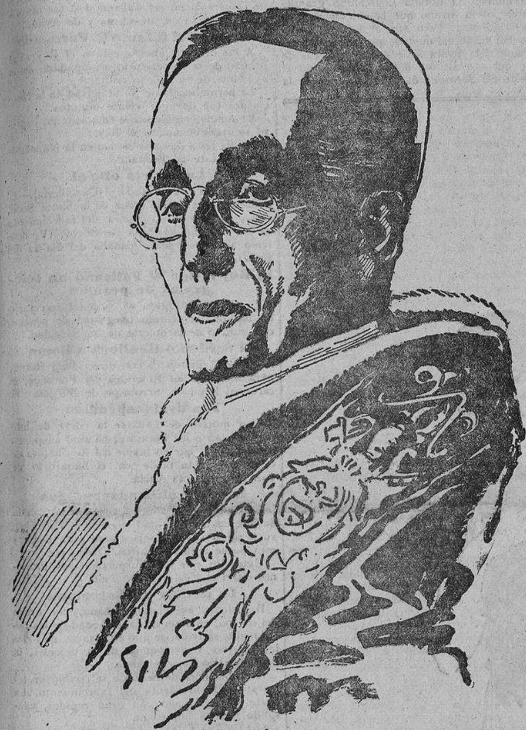
SU SANTIDAD BENEDICTO XV