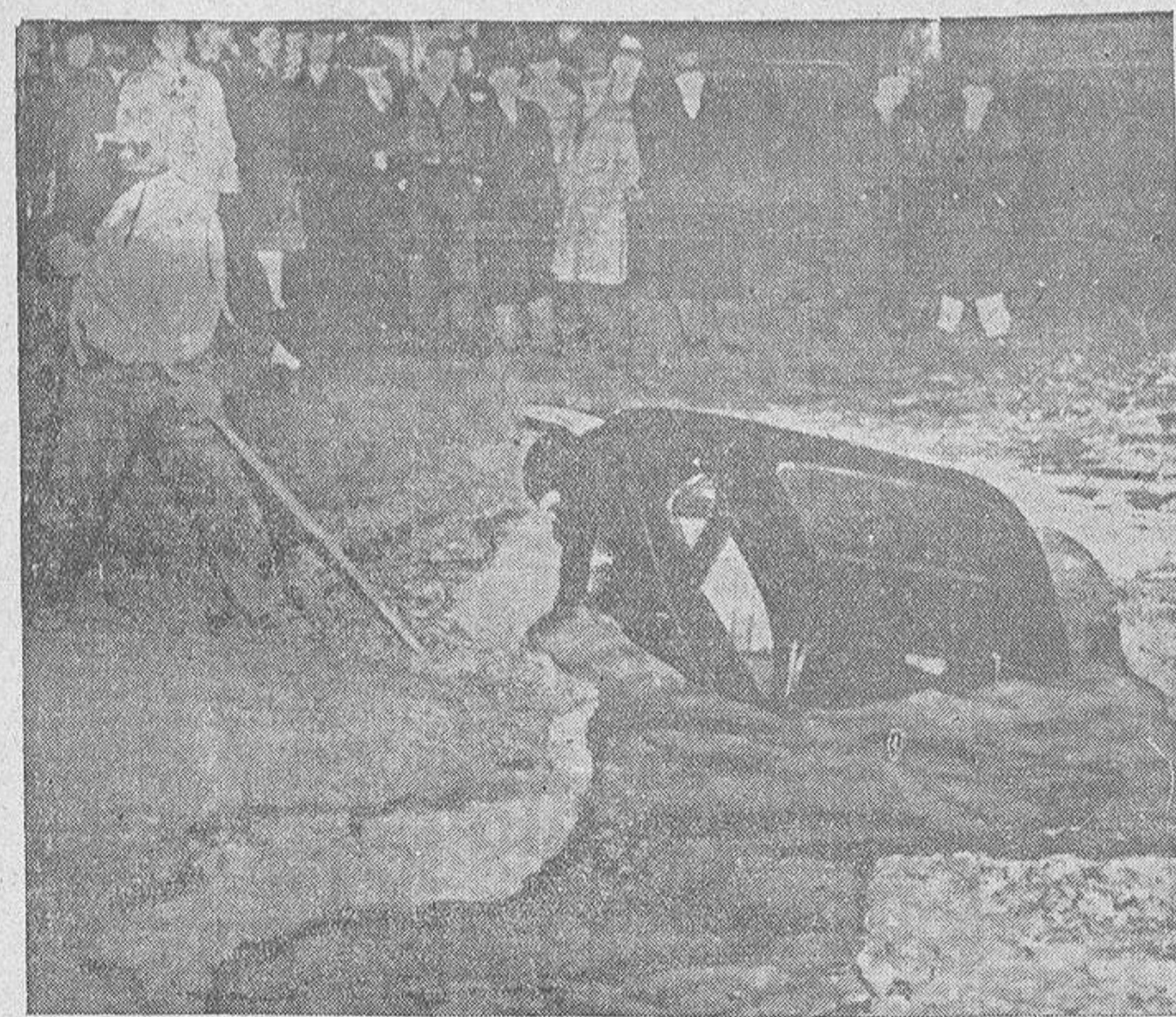
La reciente tempestad de nieve que se desencadenó sobre América del Norte dió lugar a cenas como esta que reproduce el grabado. El conductor dejó su "auto" sobre el hielo que cubría un lago. Cuando regresó el coche se había sumergido en el agua al fundirse el hielo

Les acompañaba el jefe provincial del servicio del turismo. Los excursionistas visitaron la Mezquita, el Palacio episcopal, el Museo de Bellas Artes y otros monumentos. Seguidamente reanudaron el viaje.