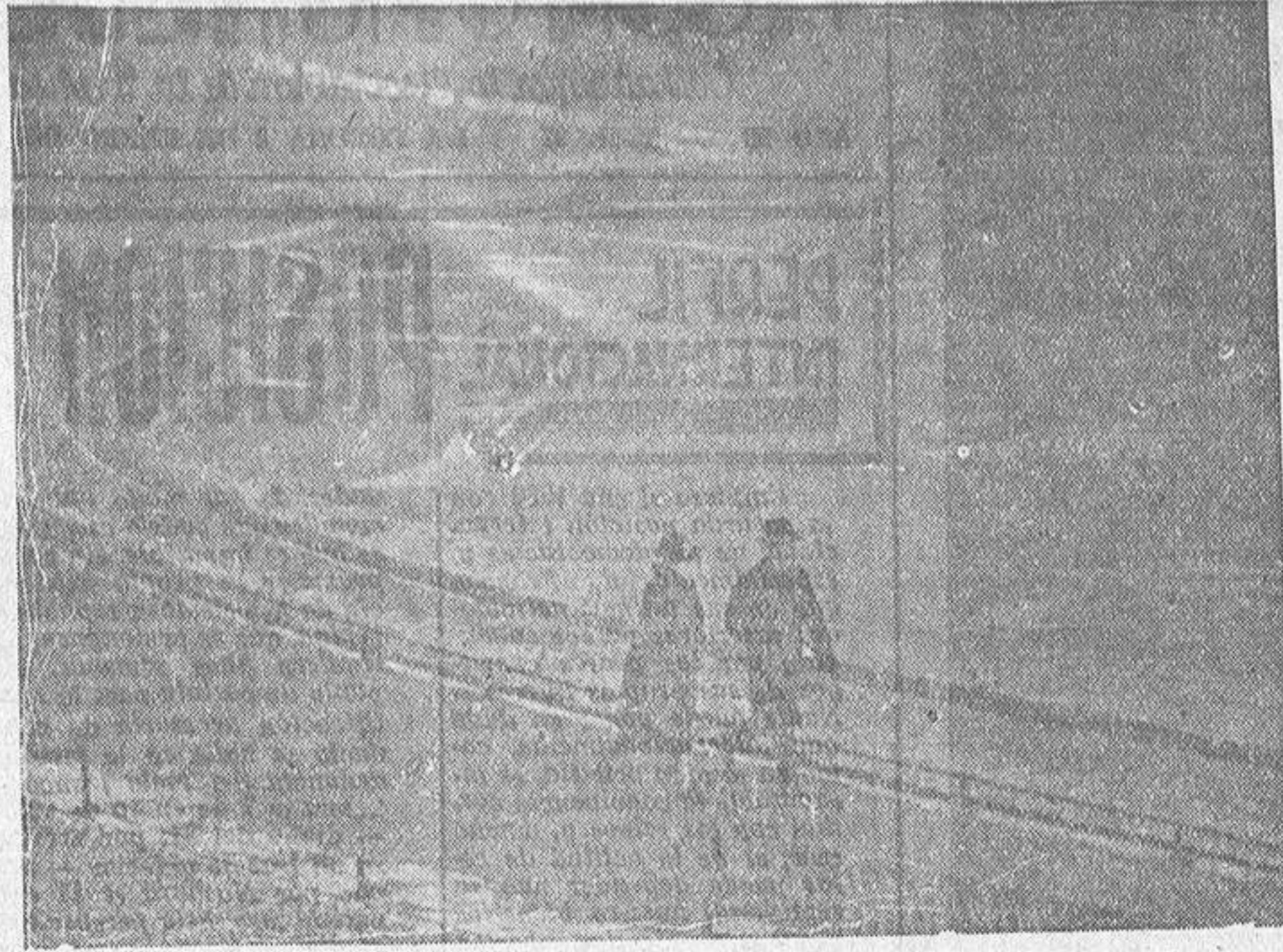
El primer ministro británico y su señora durante su habitual paseo matinal por el parque de San Jaime, que ofrece el espectáculo maravilloso de una gran nevada

Barja, hemos dicho, que fue un elevado ejemplo para las generaciones presentes y venideras. Que se estudie su vida y en ella se aprenderá a amar a España hasta el frenesí, ansiosos de restaurar una gloria y derrotada.