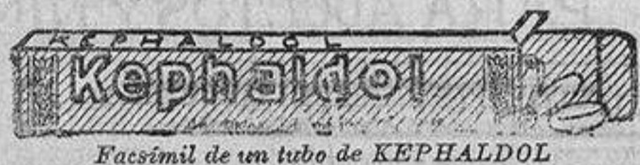
Facsimil de un tubo de KEPHALDOL

Todos estos sufrimientos, tan dolorosos por su carácter agudo, desaparecerán desde ahora fácil, y rápidamente, con algunas pastillas comprimidas de KEPHALDOL. Si vuestra ciática es muy violenta ó muy antigua, será tal vez necesario tomar dos ó tres pastillas durante algunos días; pero no olvidéis que una pastilla comprimida de KEPHALDOL no cuesta más que doce céntimos y medio, y que podéis absorberla sin peligro, pues el KEPHALDOL es inofensivo como el pan que coméis y el agua que bebéis.