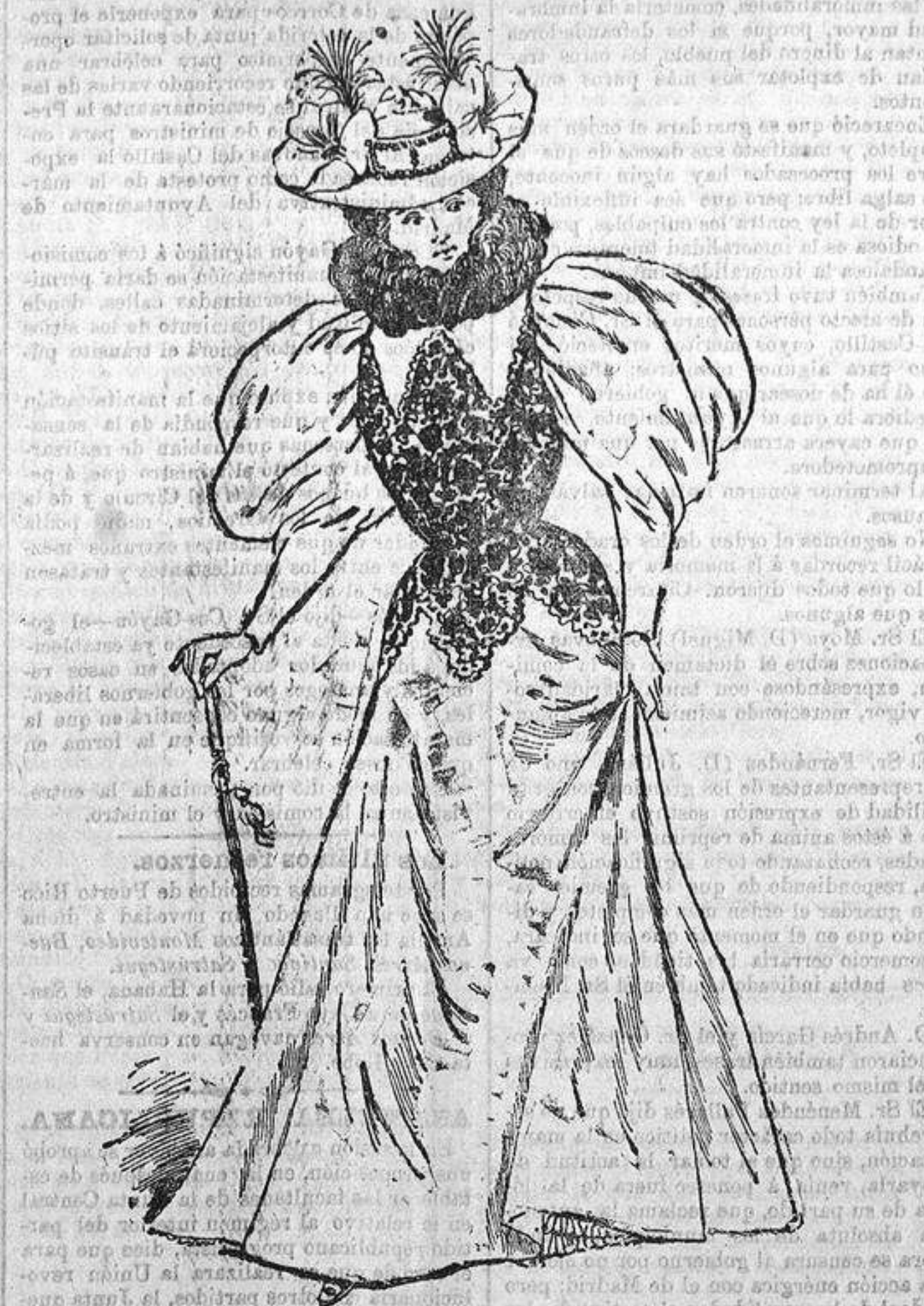
TRAJE DE CALLE

Vestido de paño azul húsar. Se compone de una falda acampanada y de un cuerpo compuesto de un canesú del mismo paño que entra en una blusa descolada de gruesa gubieru, bordada de lentejuelas negras con faldón análogo. Manga al bis. Cuello alto recubierto por un boa de pluma. El cuerpo se cierra invisiblemente bajo el brazo izquierdo. Sombrero de fieltro arena, guarnecido de grandes amapolas rojas de terciopelo, de dos plumeros negros y de una hebillita de strass.