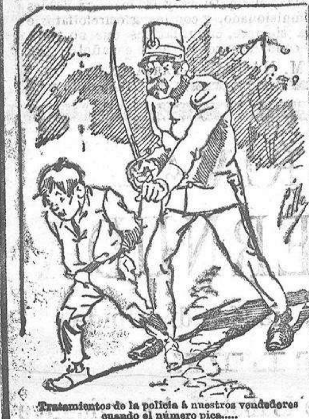
Tratamiento de la policía á nuestros vendedores cuando el número pica...

Abominan á nuestros libros... pero los compran. con sólo indicar el nombre y dirección del que lo desea en sobre dirigido al Sr. Administrador de