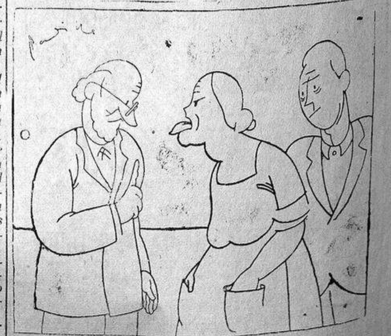
—El Doctor.—Tiene la lengua muy sucia. —El marido.—Es eso que no la ha oído usted.