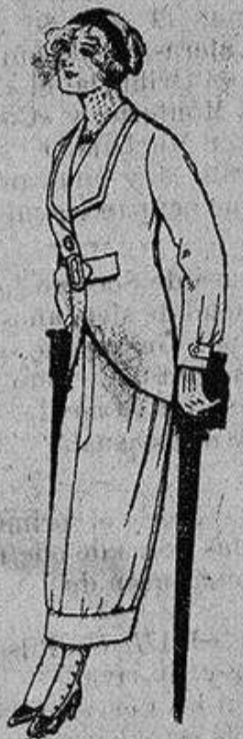
Trajes de lanilla para jovencitas de 13 a 16 años A Ptas. 27

EL NUEVO JABÓN FLORES DEL CAMPO ES UN PRODUCTO CIENTÍFICO QUE LA PERFUMERÍA FLORALIA OFRECE A LA COQUETERÍA FEMENINA