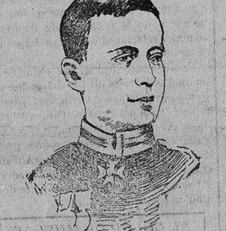
El coronel Tempson Jefe holandés de la gendarmería albanesa, muerto por los rebeldes en el ataque a Durazzo.