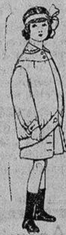
Trajes de lanilla para niños de 4 a 12 años De Ptas. 20 a 30

PRECIO FIJO y VENTAS AL CONTADO PIDASE EL CATALOGO GENERAL