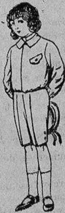
Trajes de lanilla, vicuña o jerga, para niños de 4 a 9 años De Ptas. 5 a 10

SECCIONES: Camisería, Géneros de Punto, Corbatería, Guantería, Sombrerería, Zapatería, Paraguas, Bastones y Artículos para Viaje.