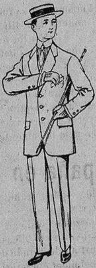
Trajes de lanilla vicuña, etc., para niños de 10 a 15 años De Ptas. 14 a 48