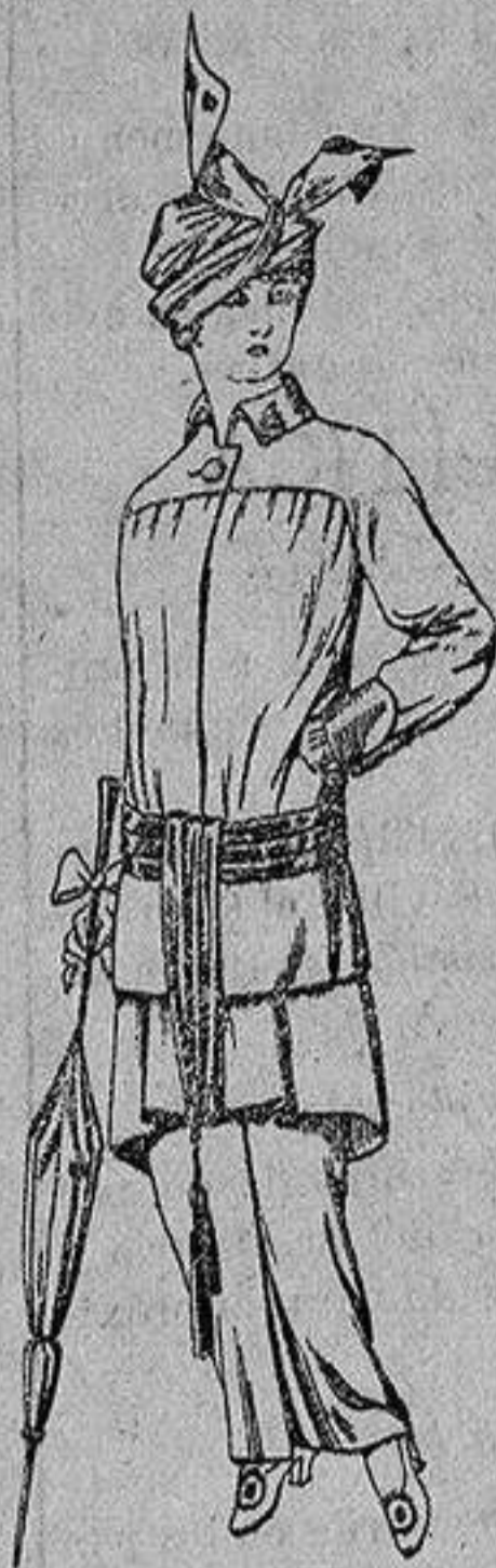
Traje de jerga azul o negra y géneros novedad, para señora De Ptas. 65 a 80