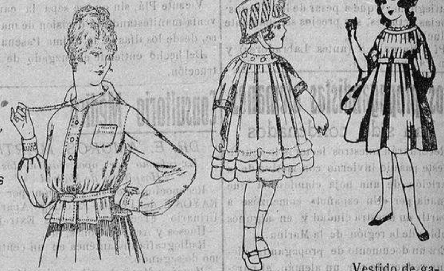
Blusa batista blanca, cuello con calados. A ptas. 4'50.

Camisería, Cénseras de Punto, Corbatería, Guantería, Sombrerería, Zapatería, Bastones, Paraguas y Artículos de Viaje