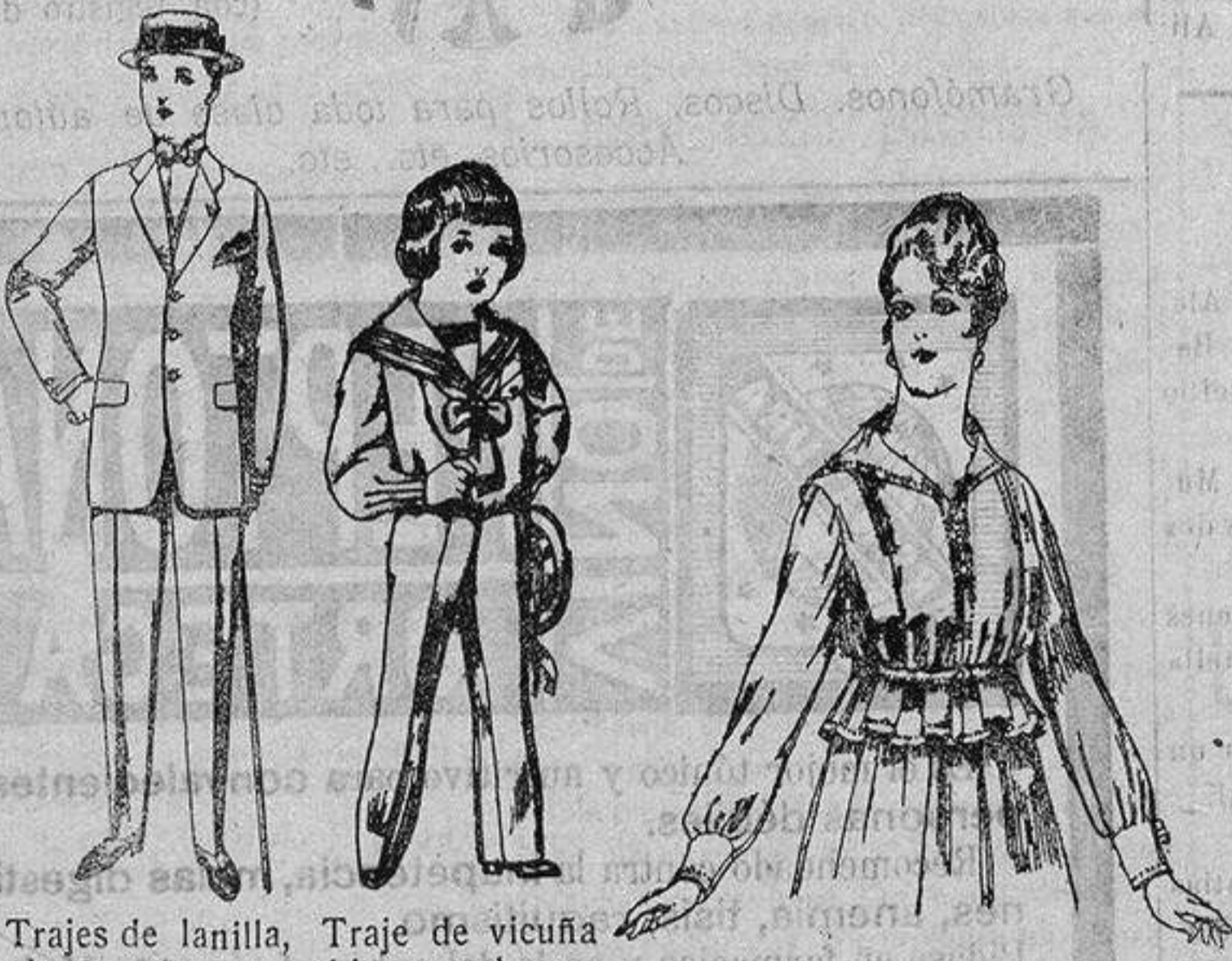
Trajes de lanilla, vicuña, etc., para jovencitos de 10 a 17 años. De ptas. 17 a 50.