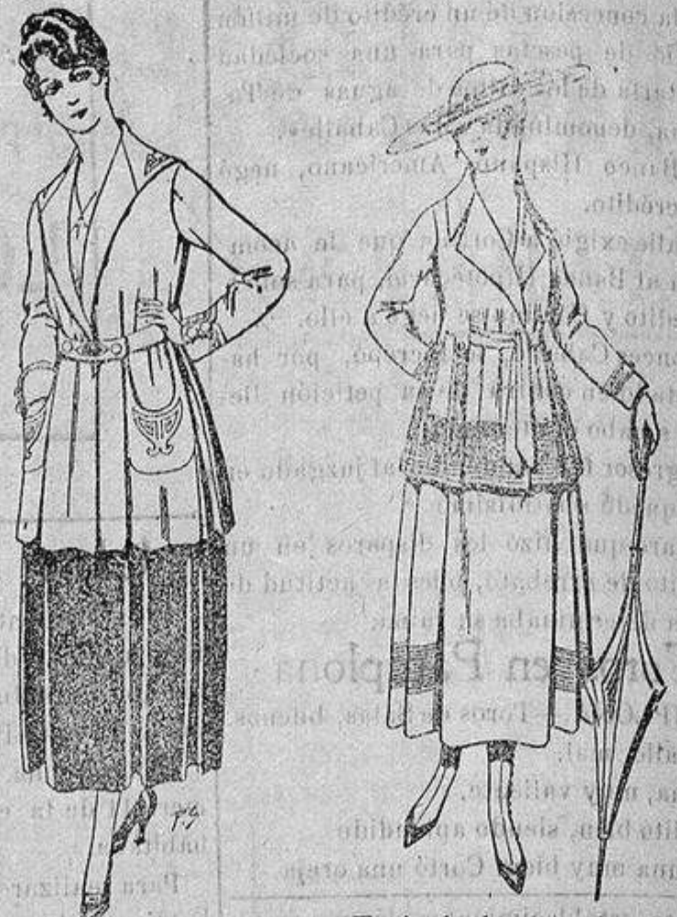
Paletot de tricot de seda o lana. De ptas. 14 a 57.