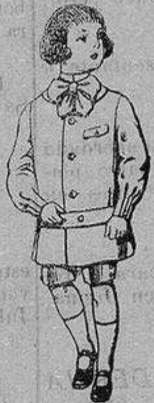
Trajes de lanilla en colores para niños de 4 a 9 años. De ptas. 9 a 18

Precio Fijo - Ventas al contado Pídase el Catálogo General