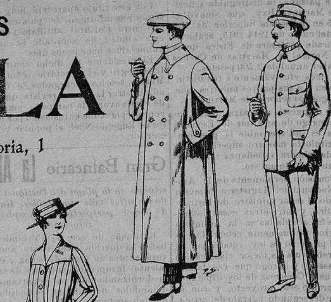
Guardapolvos de dril crudo o gris De ptas. 12'50 a 30 Guerreras de dril crudo, kaki o blanco De ptas 7'50 a 10