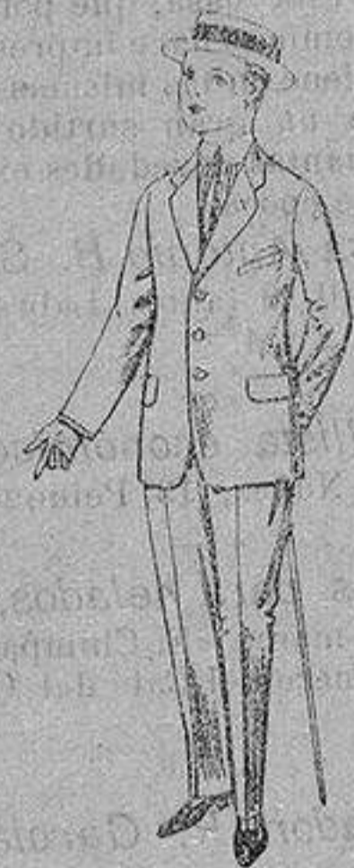
Trajes de lanilla, vicuña, etc. para juvenicos de 15 a 16 años. De ptas. 17 a 48

Camisería, Géneros de Punto, Corbatería, Guantería, Sombrereria, Zapatería, Paraguas, Bastones y Artículos de Viaje.