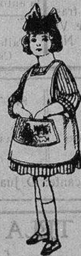
Delantal de dril color bedge De ptas. 3 a 7

Precio Fijo - Ventas al contado Pídase el Catálogo General