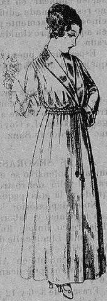
Bata crespón colores varios, cuello y boca-manga seda. De ptas. 15 a 20