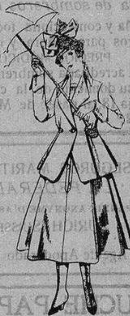
Trajes de lanilla negra azul y color, para jovencitas de 13 a 16 años. De ptas. 50 a 55