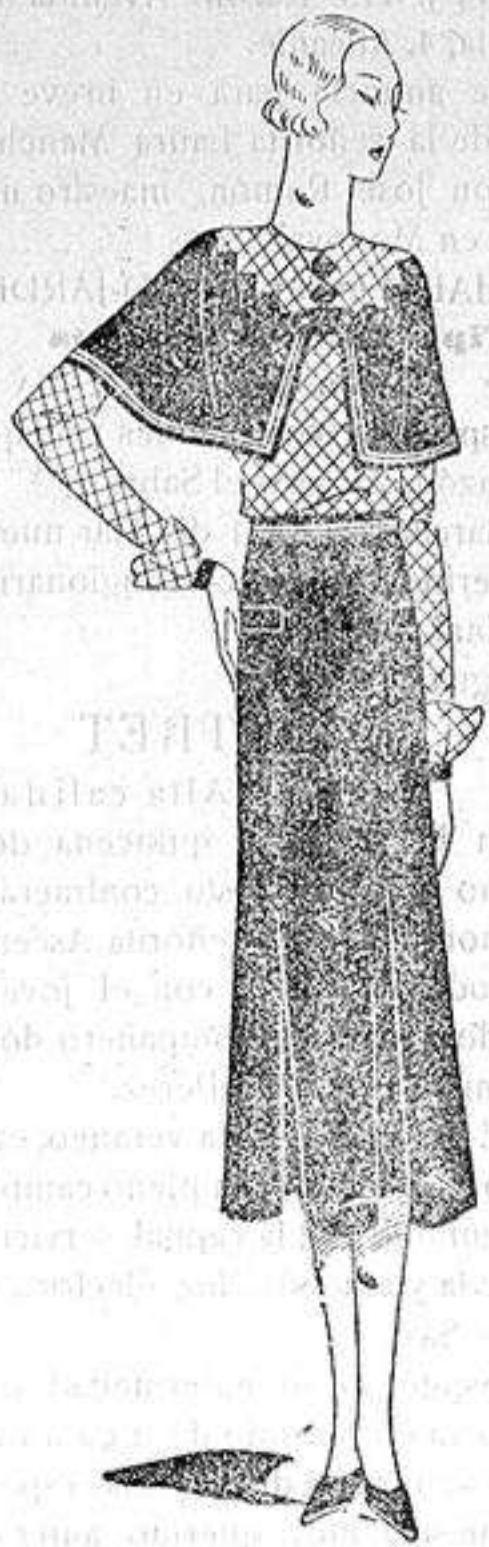
Falda y pelerina de triest gris azul, la pelerina bordada.—Blusa de puntilla de lamé blanca.

todas las mujeres son hermosas, tampoco todas son buenas, y hasta diremos incluso que cuando a una mujer le da por ser fea o mala, deja chiquitos a los hombres que estén aquejados en mayor grado de esos defectos.