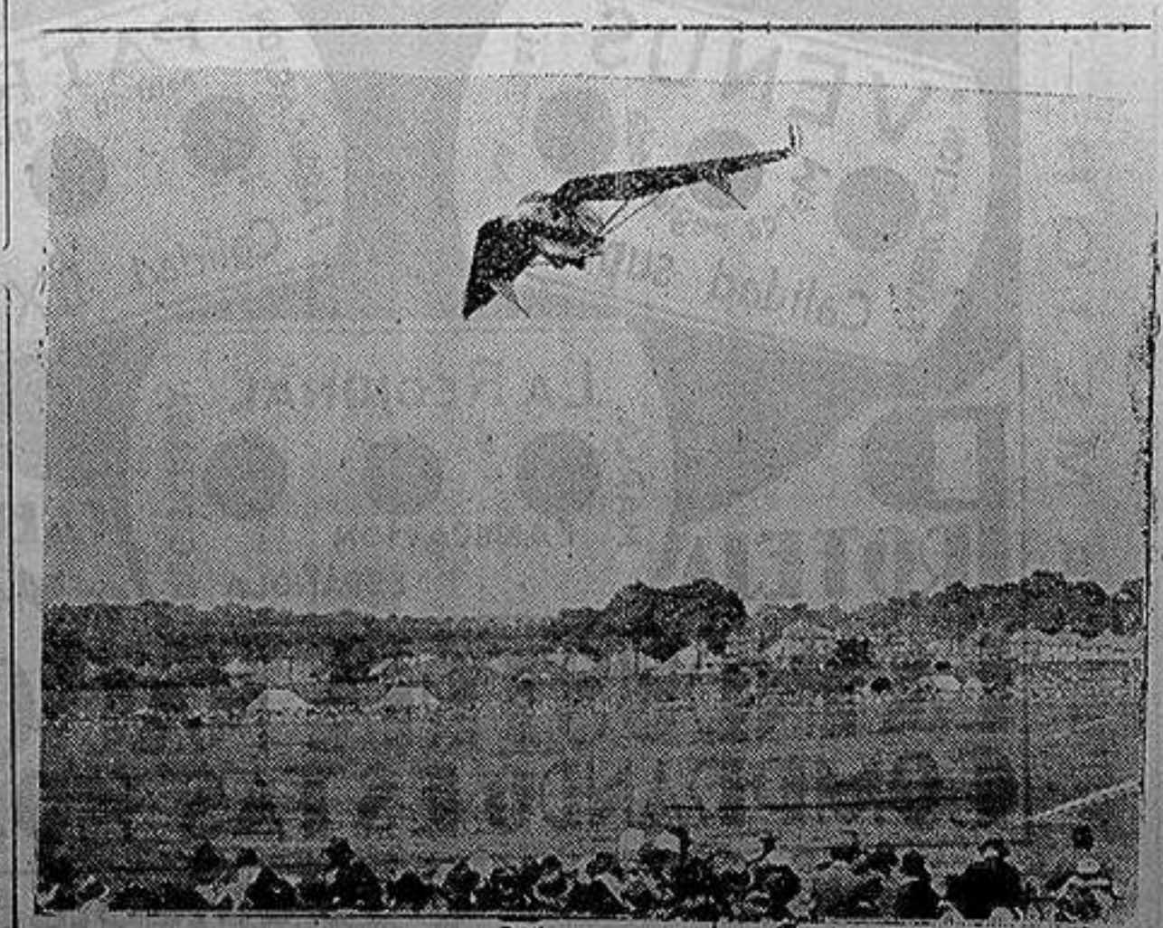
Inglaterra. — En el Mitin Aéreo de Hendon. — He aquí al avión sin cola evolucionando sobre el aeródromo.