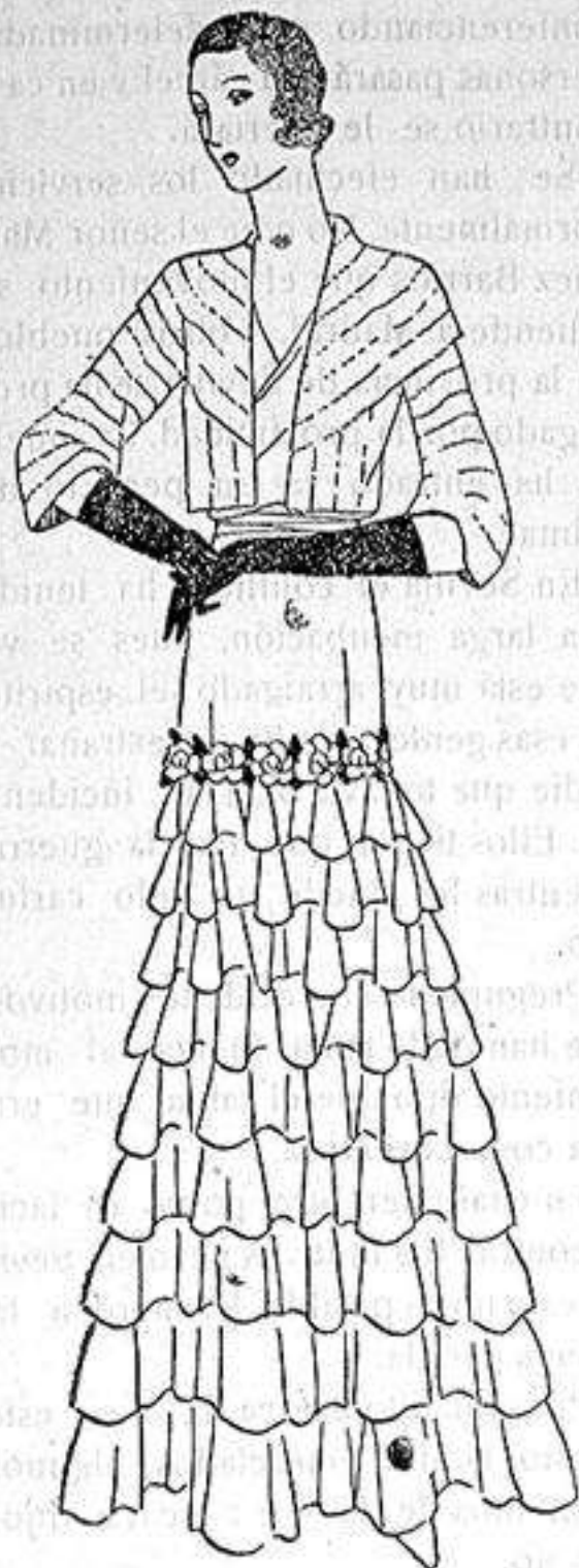
Vestido de tul blanco, adornado con una guirnalda de camelias en las caderas. Bolero de hermine.