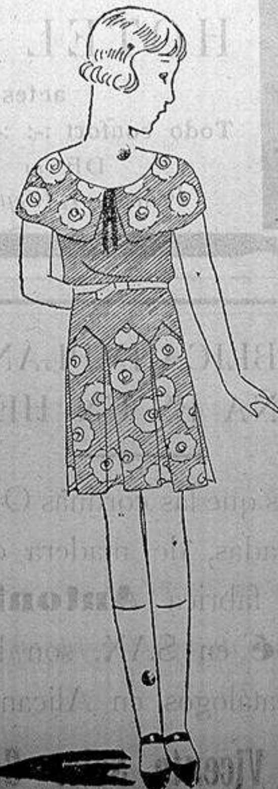
Vestido de muselina rosa con flores de diferentes colores.

Esto está muy bien, pero siempre con las naturales reservas y tomando antes todas las garantías necesarias. De la misma manera como no