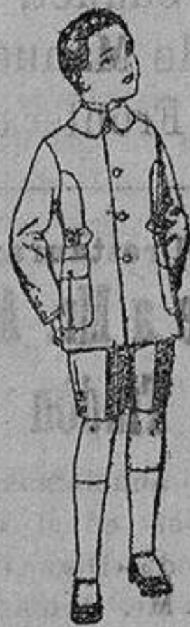
Trajes modelo «Sport», de lanilla, estambre, melton, etc., para niños de 9 a 4 años de ptas. 30 a 48. Trajes de dril liso o listado. de ptas. 9 a 18