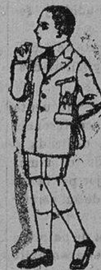
Trajes modelo Sport, lanilla, estambre, etc. para niños 7 a 12 años de 28 ptas a 50. Trajes delantal de dril crudo o kaki, para niños de 3 a 7 años. de ptas. 9 a 15