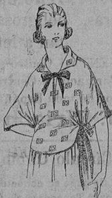
Blusas crêpón de seda, voile y etamin estampado de ptas. 4 a 25