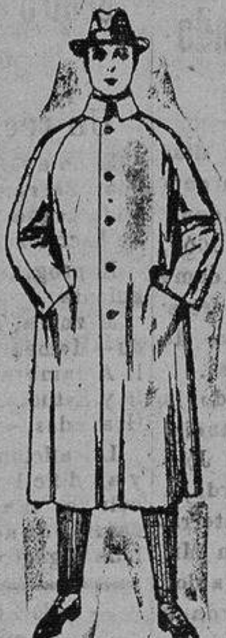
Gabanes de patén, cheviot o wer. de ptas. 80 a 160

Ropas confeccionadas para Caballero, Señora, Niño y Niña