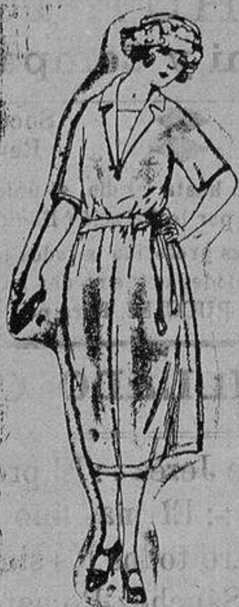
Trajes de sarga inglesa, estambre, etc., negro, azul color, de ptas. 180 a 188