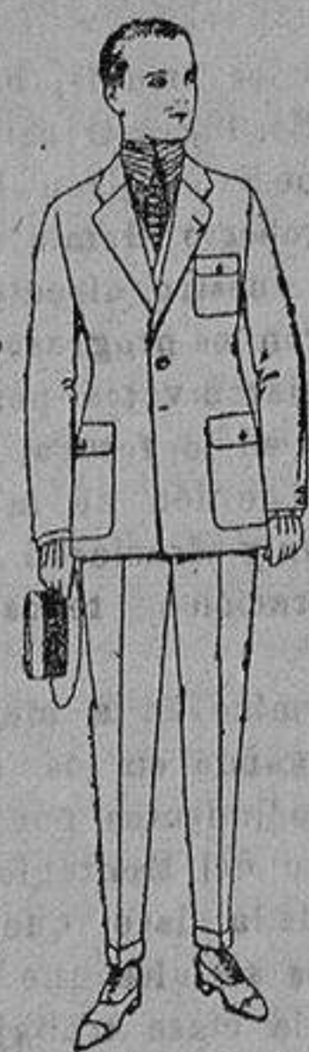
Trajes de dril crudo, kaki o listado. de ptas. 22.50 a 60. El mismo modelo en estambre «Presco». de ptas. 50 a 140