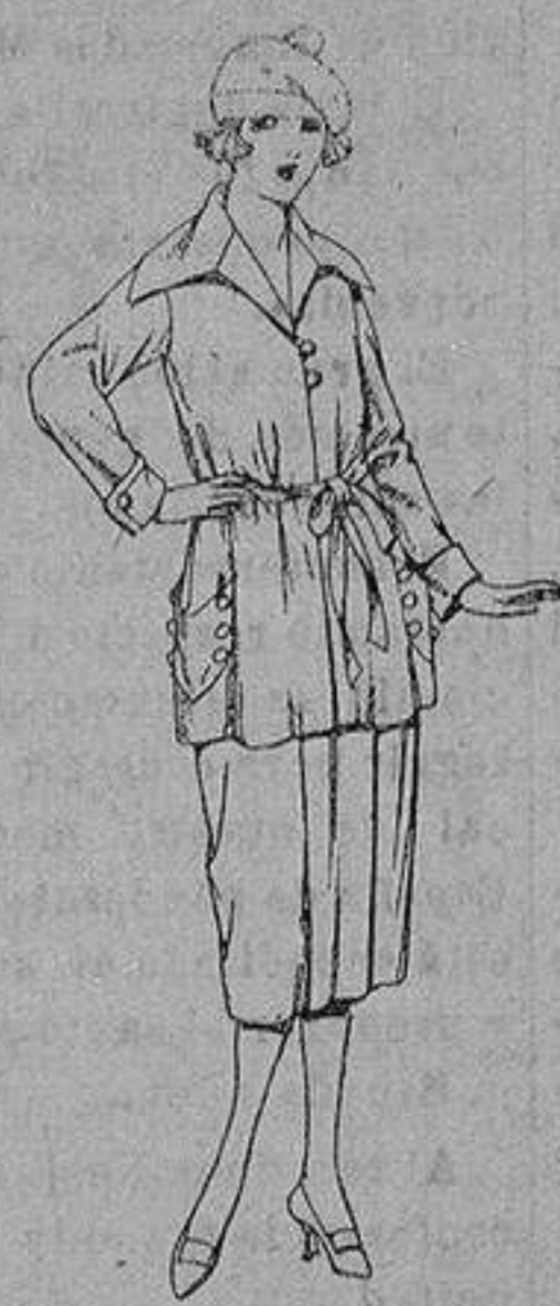
Vestidos de punto de seda, en negro, azul y color. de ptas. 180 a 230