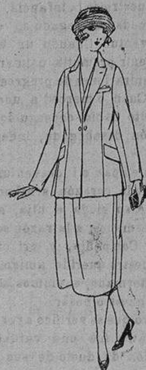
Paletots de tricot de seda, negro azul y color. de ptas. 55 a 168.