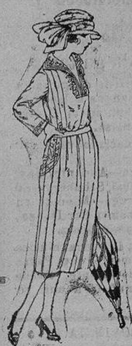
Vestidos gabardina, sarga inglesa, etc., en negro azul y color adornos bordados. de ptas. 110 a 130