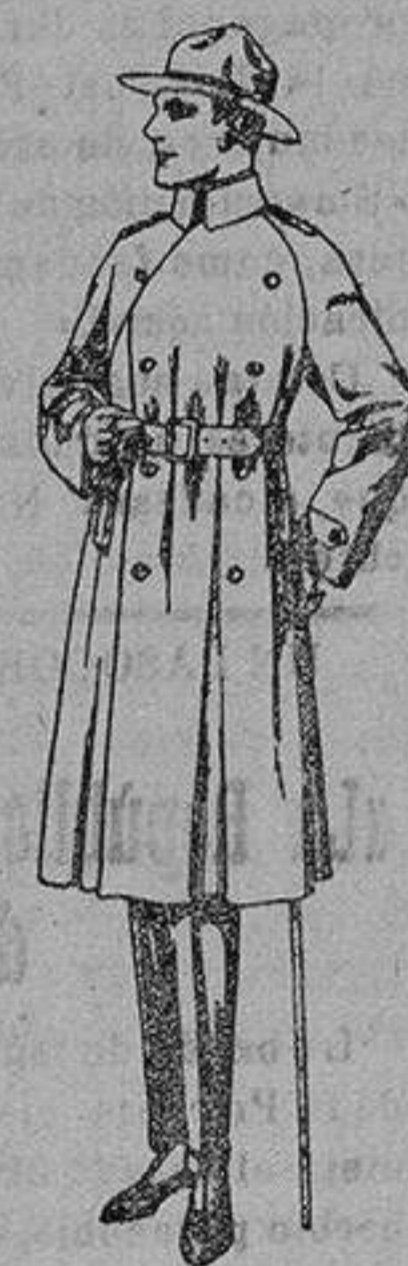
Gabanes impermeabilizados con cinturón «American trench coat». de ptas. 200 a 350

PRECIO FIJO :: VENTAS AL CONTADO PIDASE CATALOGO GENERAL