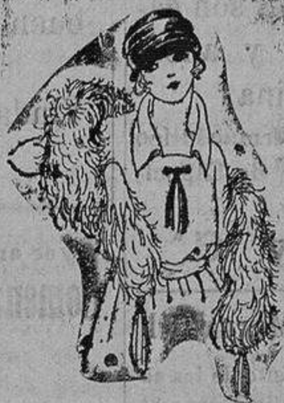
Boas de plumas avestruz, gran variedad en colores y tamaños de ptas. 15 a 125. Gran surtido en capelitas de marabú de ptas. 30 a 70.