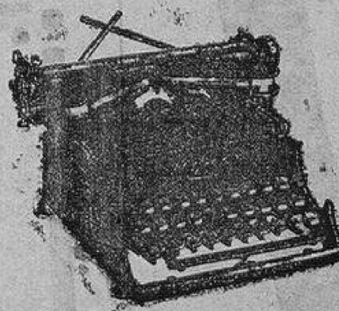
Para viaje 500 pesetas

TRÁSE LAS CAN con el agua Virgenal progresiva; no ensucia la piel; la opacifica la caspa y la casca de pelo; le devuelve su primitivo color; le fortalece, es inofensiva. Drogue ria de José Juan, Canalejas 15. Frasco, 8 pesetas.