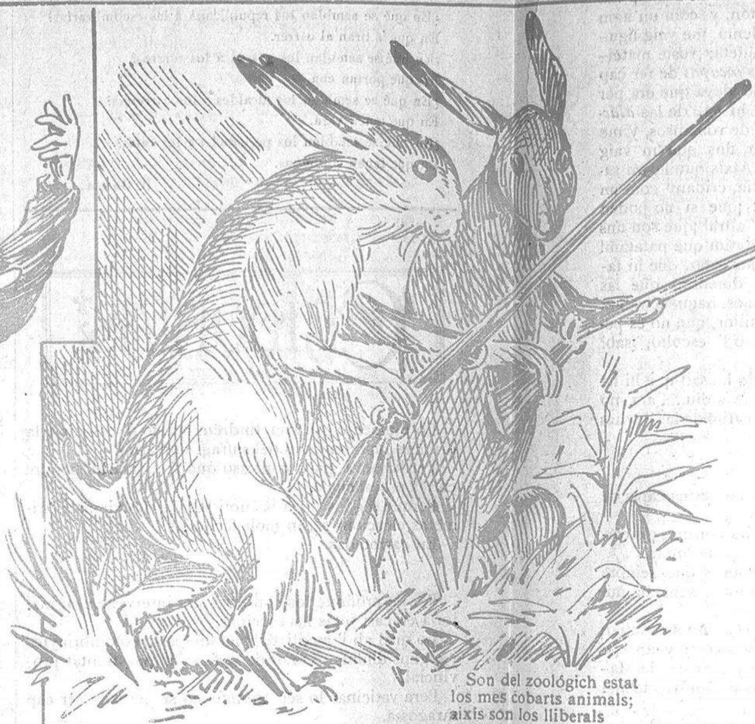
Son del zoològich estat los mes cobarts animals; aixís son los liberals en las horas de combat.