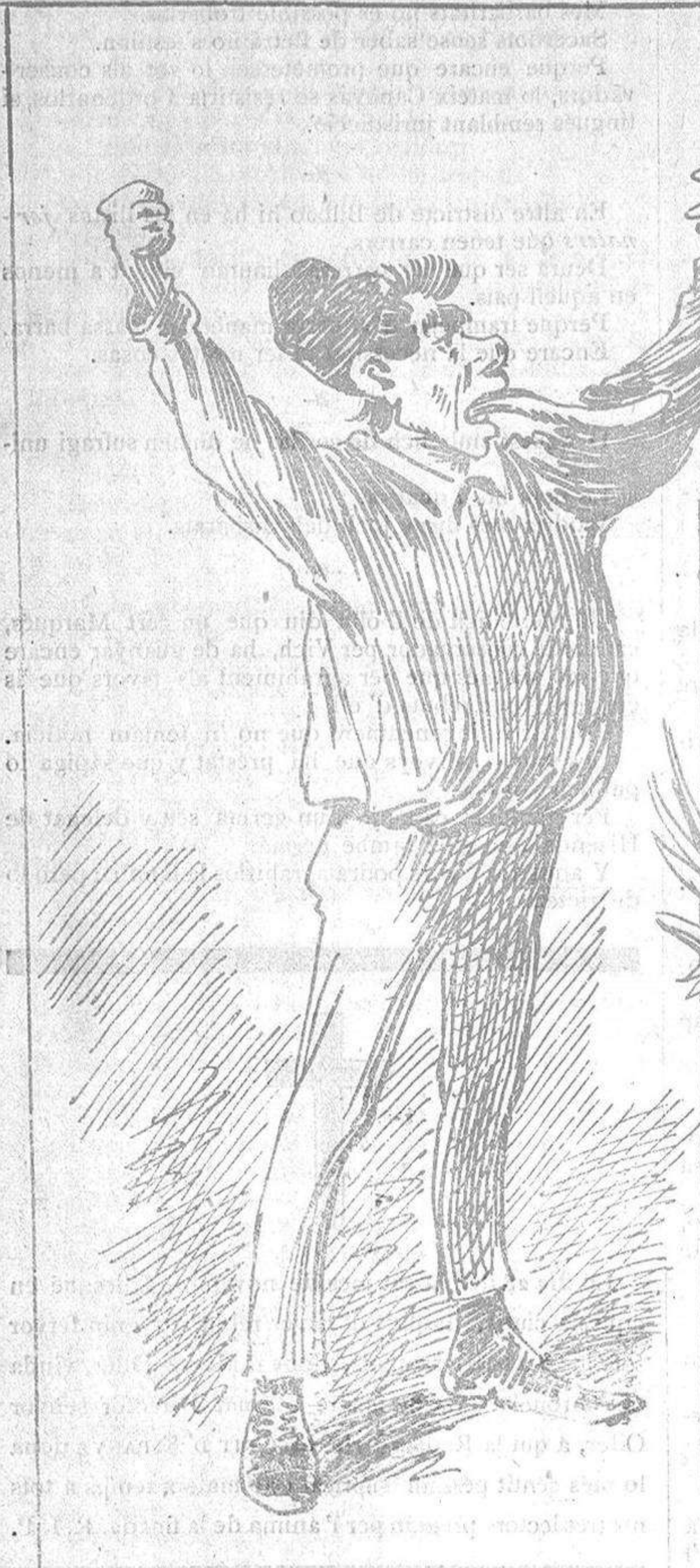
Tant en lo mon he cridat..... he fet tanta y tanta arenga, que, mireus com tinch la llenga, ja no es llenga, es un barat!