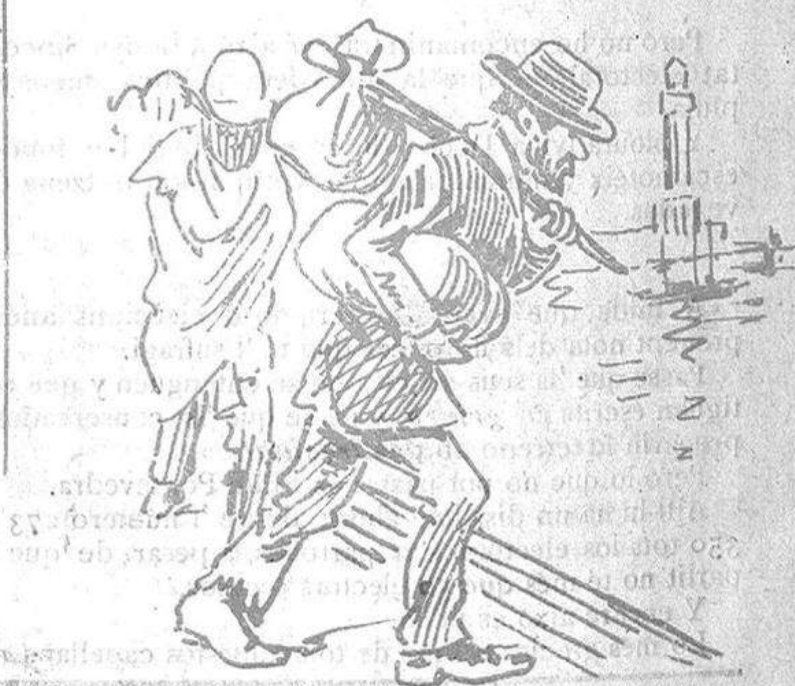
Diu que á América 'ns morim també de gana... Bè, sí..... pero mes pitxor aquí! que ni ahont caure morts tenim.