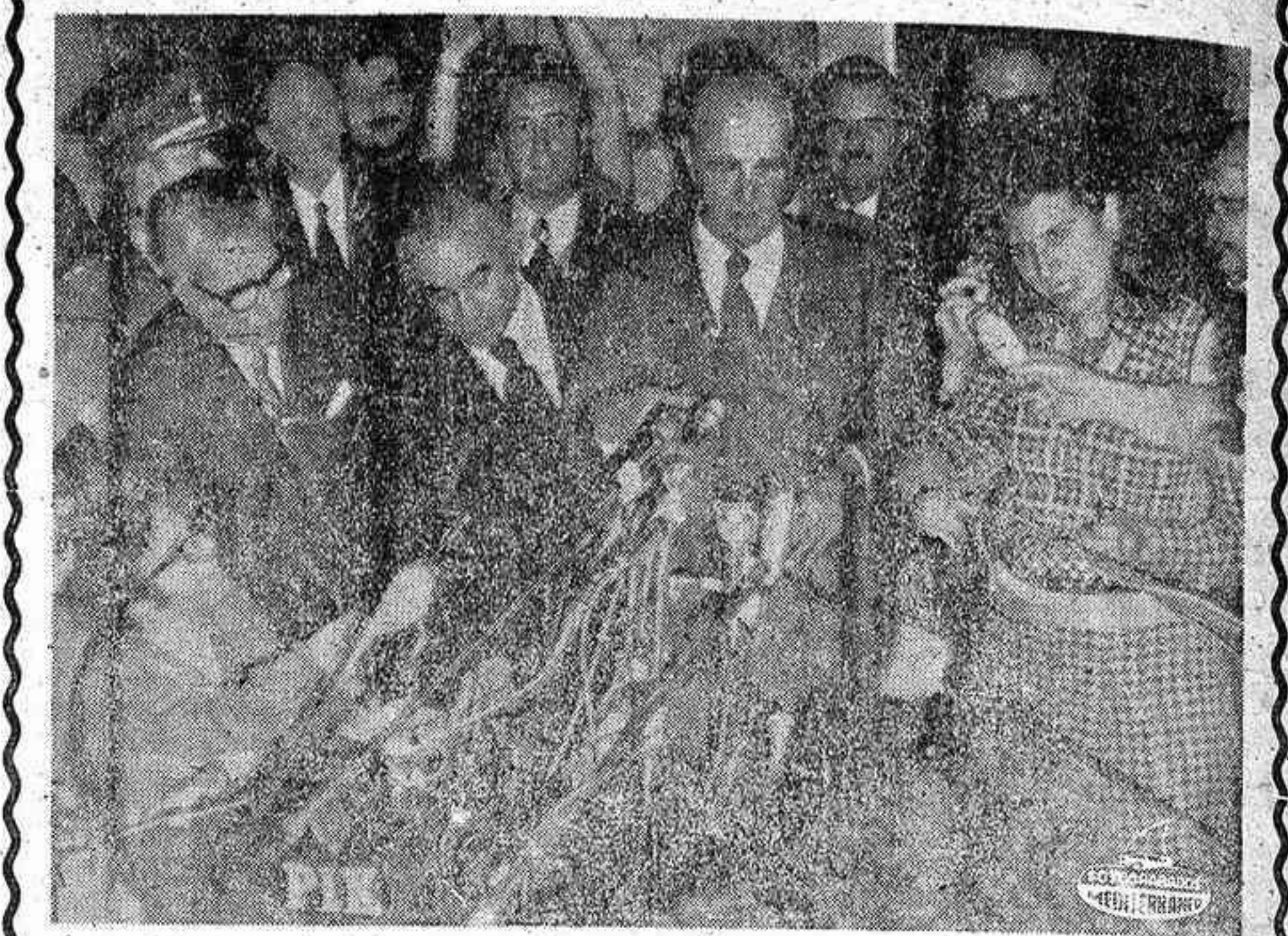
ATENAS. — El jefe del gobierno griego, Constantino Karamanlis, dirigente del partido político Nueva Democracia, en el curso de una conferencia con los periodistas extranjeros, a quienes habló sobre su victoria en las elecciones parlamentarias del país.

El debate debe terminar el jueves, fecha en que se registrarán, en este orden, las intervenciones de Estados Unidos, España y Argelia que se esperan con las amenazas publicadas en la prensa americana sobre un posible patrocinio de algunos países europeos de la resolución. El New York Times citaba específicamente entre ellos a Grecia, Portugal y España. Suposición poco probable con Karamanlis, en el caso griego, bastante probable en el portugués e improbable