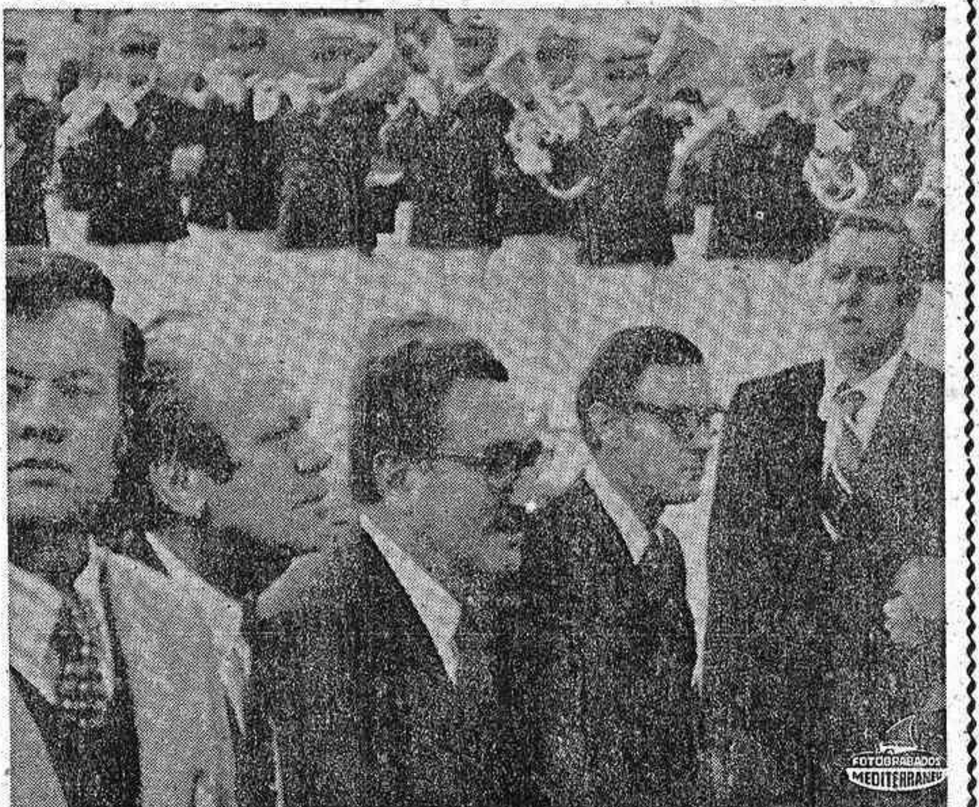
TOKIO. — El Presidente Ford y el Secretario de Estado, Henry Kissinger, aparecen rodeados por agentes de seguridad a su llegada a la Casa de Invitados del Gobierno, en el Palacio de Akasaka, a la que se trasladaron en helicóptero desde el aeropuerto de Tokio, y en la que residirá el Presidente estadounidense durante su estancia en la capital japonesa.