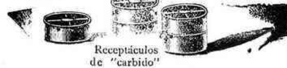
Receptáculos de "carbido"

En el presente grabado el tenedor de gas está representado en su condición baja al lugar donde el agua se derrama del tubo flexible en el embudo que comunica con el compartimiento que contiene el "Carbido" con el gas.