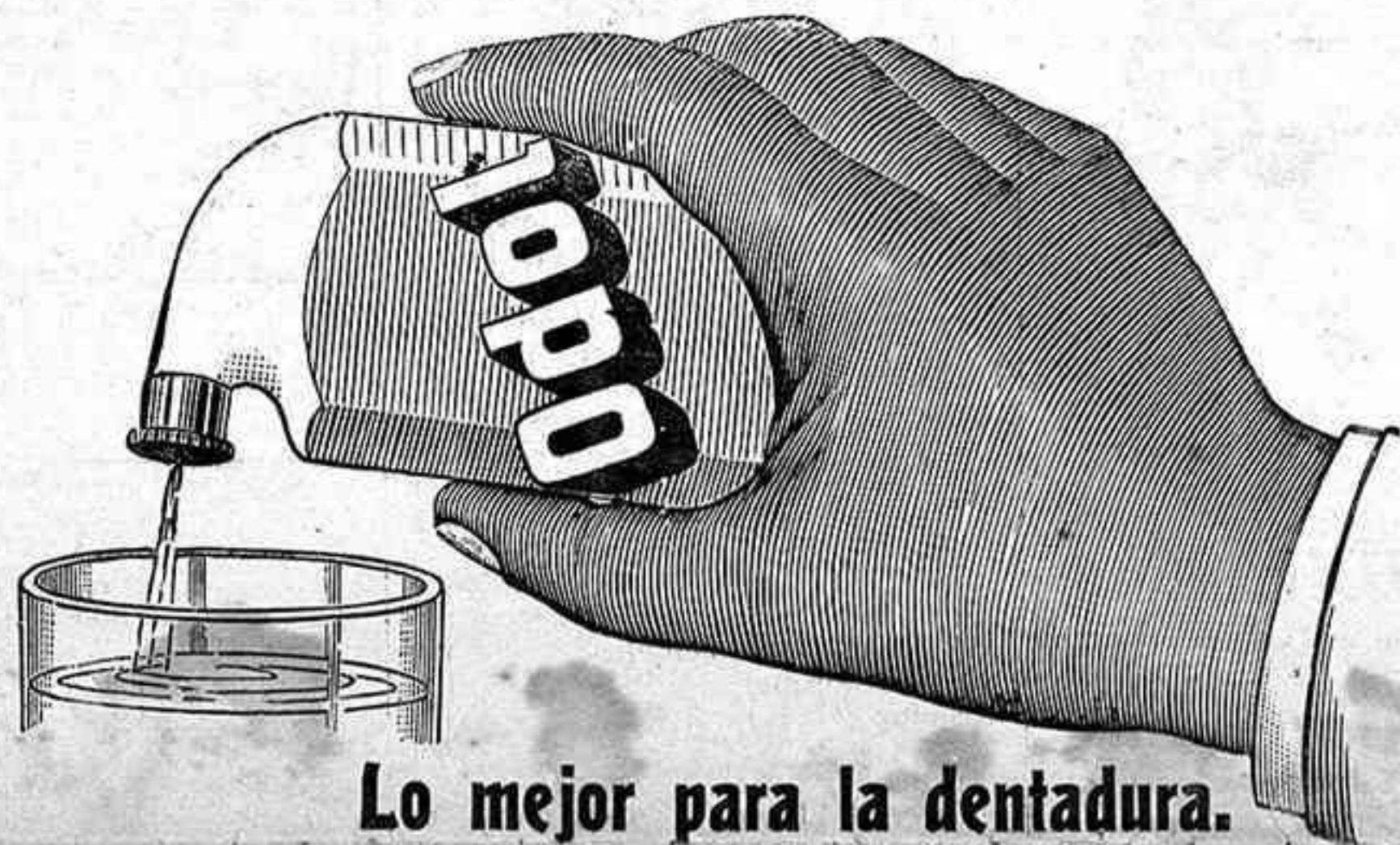
Lo mejor para la dentadura.

Con una concurrencia numerosa que llenaba el amplio salón de la