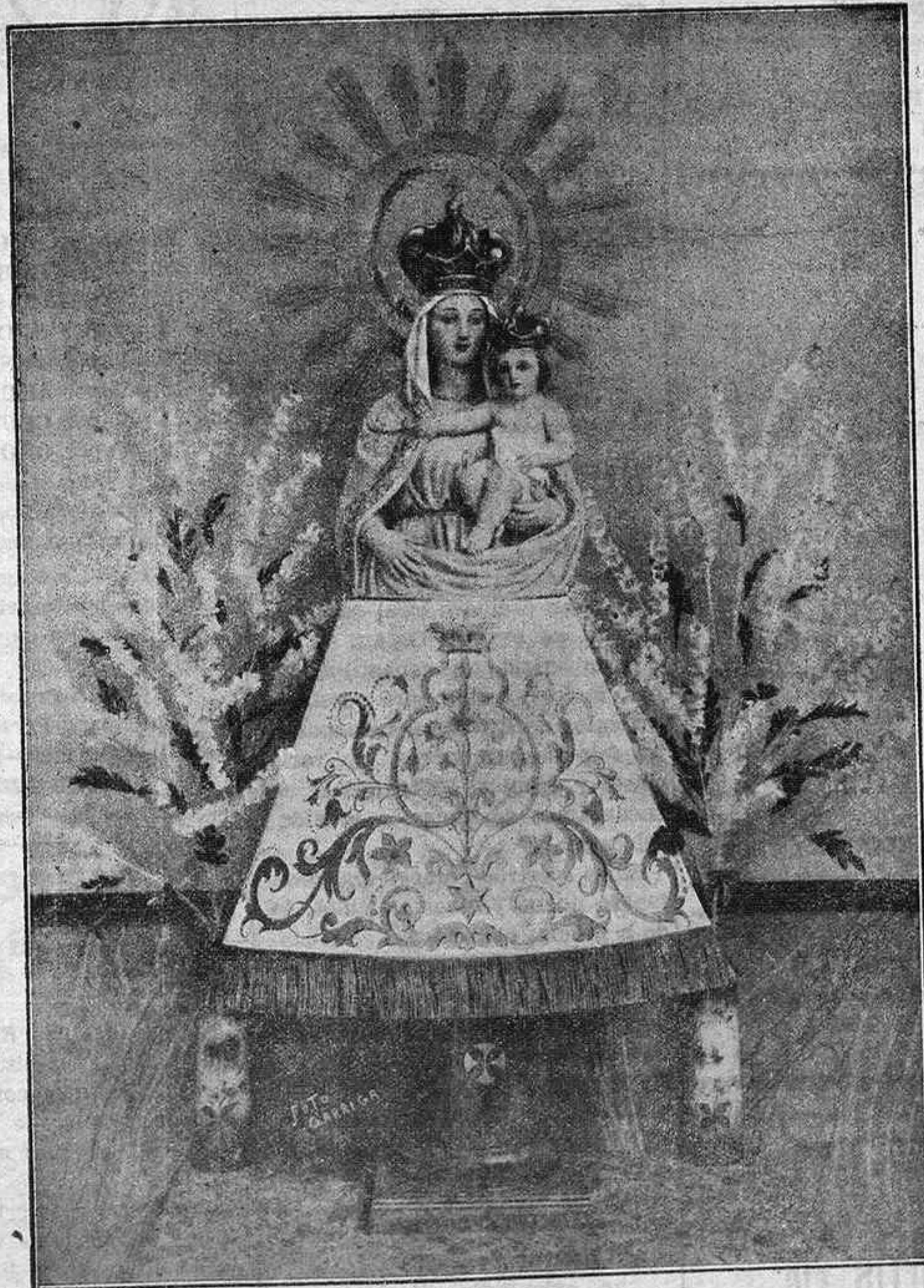
PRECIOSA IMAGEN DE NUESTRA SEÑORA DEL PILAR, QUE SE VENERA EN LA IGLESIA DE SU NOMBRE, EN ESTA CAPITAL, EN CUYO HONOR ACABA DE CELEBRARSE, EN DICHO TEMPLO, UN SOLEMNÍSIMO NOVENARIO.