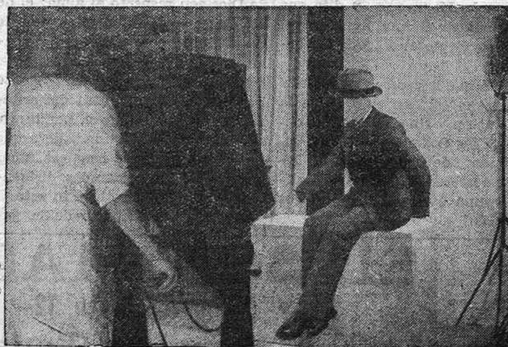
Los franceses, a la vista de los excelentes resultados de su producción la mejoran, superándose en la originalidad de los asuntos y en la interpretación artística. "El hombre invisible" es el nuevo "film" fantástico y emocionante que se realiza en sus estudios, y del cual el fotógrafo ha tomado esta escena.