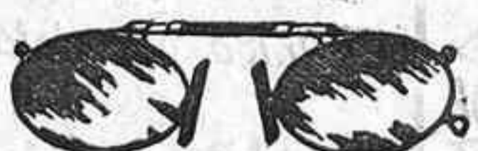
Lentes o Gatas de CRISTAL ROCA, 5 Pesetas.