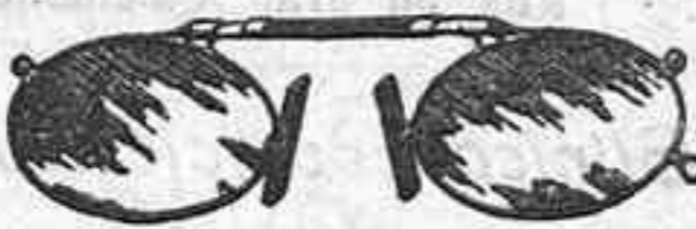
Lentes o Gatas de CRISTAL ROCA, 5 Pesetas.