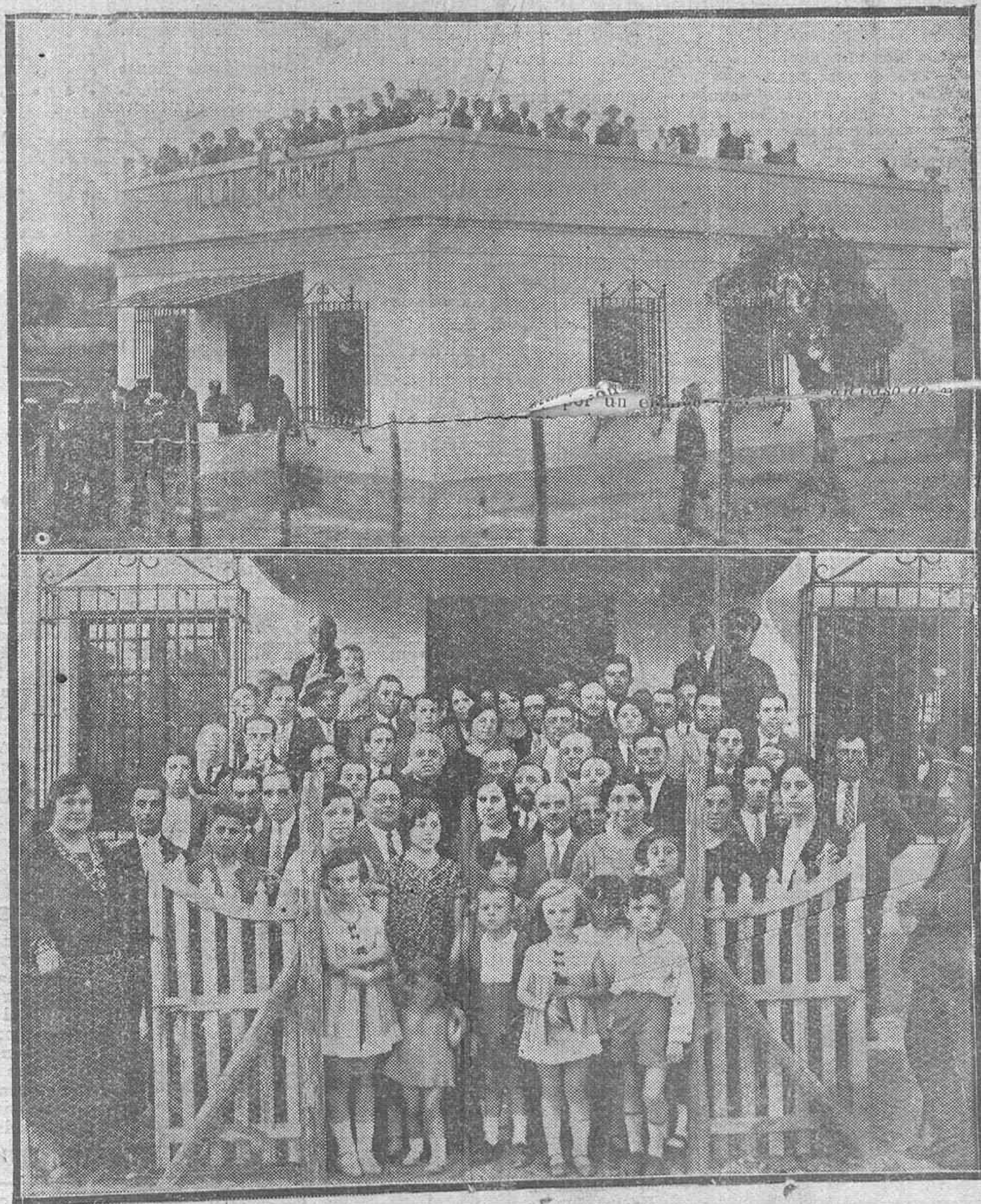
BELLA VISTA DE «VILLA CARMELA». —Crupe de concurrentes a la inauguración de «Villa Carmela», nueva casa del Banco de Ahorro y Construcción.