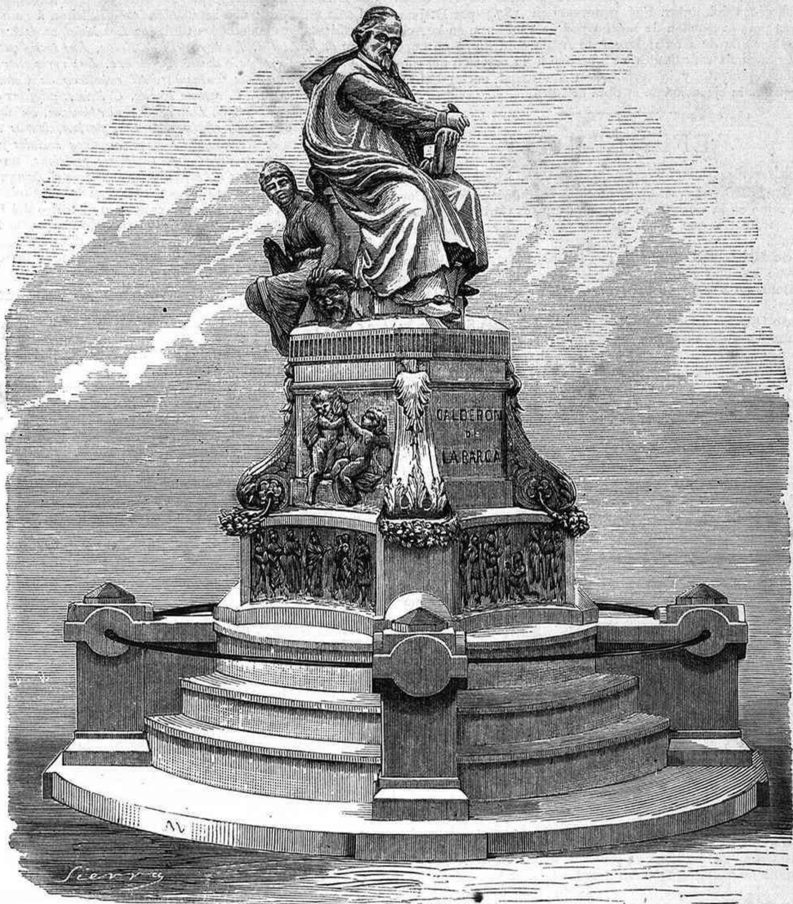
MONUMENTO ERIGIDO EN LA PLAZA DE SANTA ANA Á LA MEMORIA DEL INSIGNE DRAMÁTICO ESPAÑOL

Parece que no ha sido infructífera nuestra idea de una sociedad de socorros mutuos de asturianos residentes en Madrid. Es probable que dentro de poco tiempo se les convoque á una gran reunion en la que se dé cuenta de las bases que han de regirla. Creemos que no faltará la cooperacion de nuestros paisanos á tan loable pensamiento; y pensamos que la congregacion de Nuestra Señora de Covadonga, establecida en la parroquia de San Luis de esta corte, en la que por estatutos se admite á los naturales y oriundos de aquel país, pudiera servir de base para organizar sobre ella una institucion cada día más necesaria.