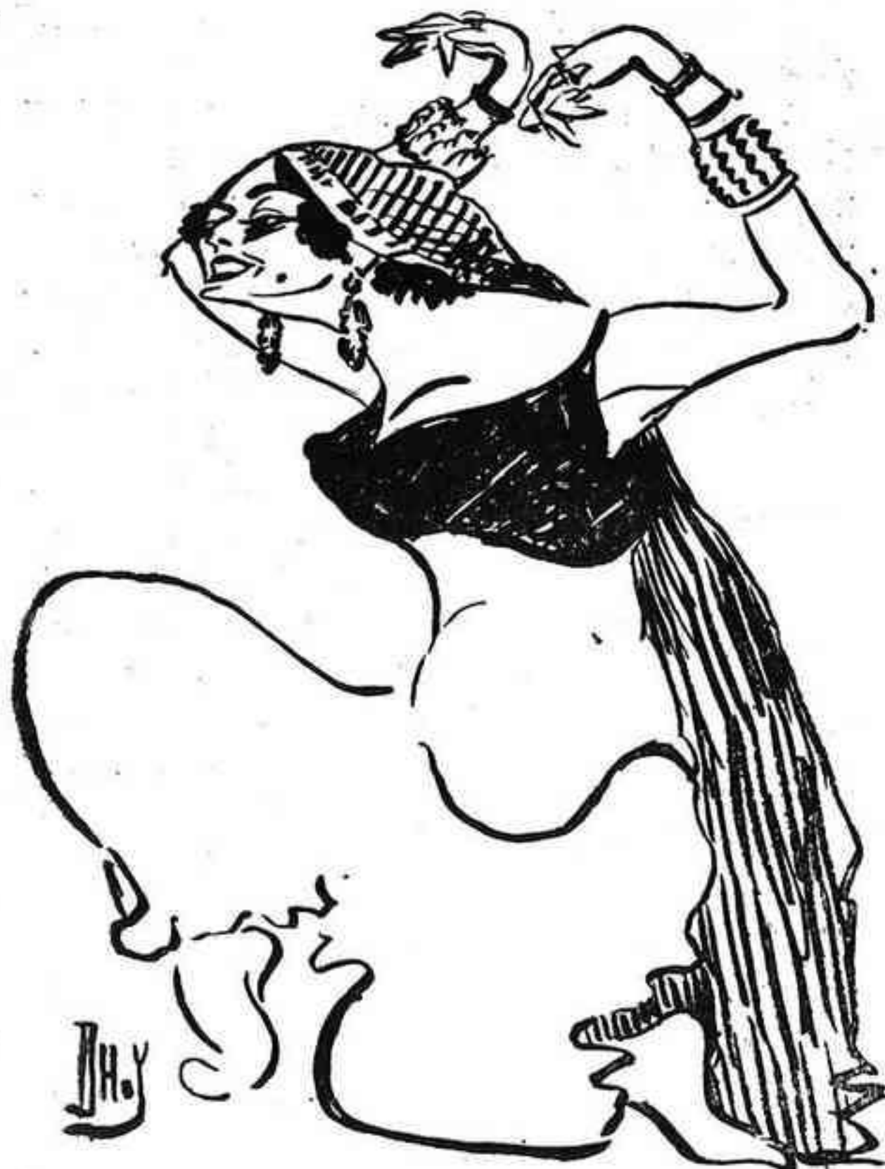
UN «MOMENTO» DE TÓRTOLA

singular. Es un francés, que últimamente me persiguió en París como un desesperado.