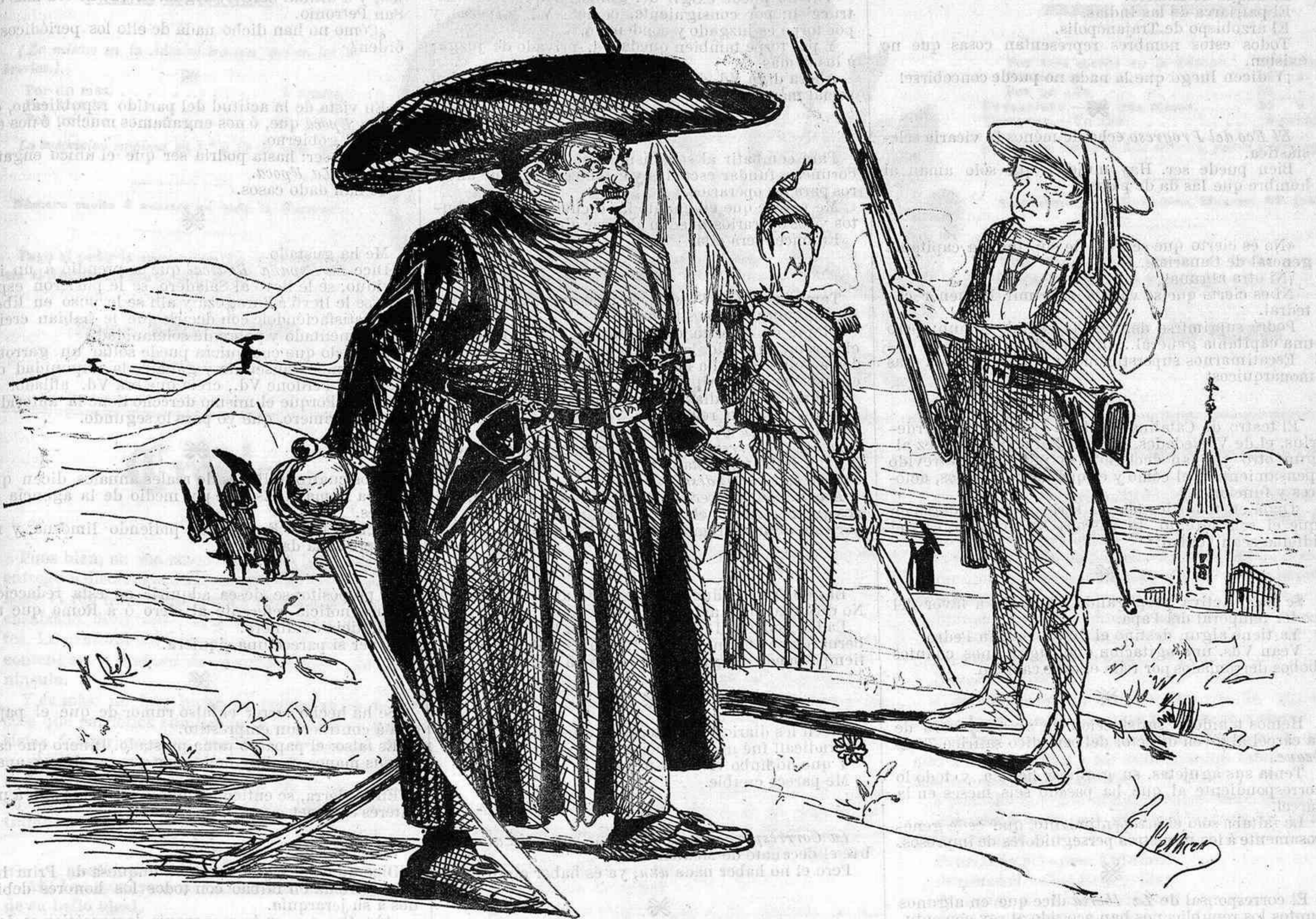
Esperando el día 10, según se dice.

Economías hay en esto, no lo dudo: pasarán cien años , y cada kilómetro de carretera nos habrá proporcionado 500 rs.; con más, la ventaja de que ya no existirán las carreteras.