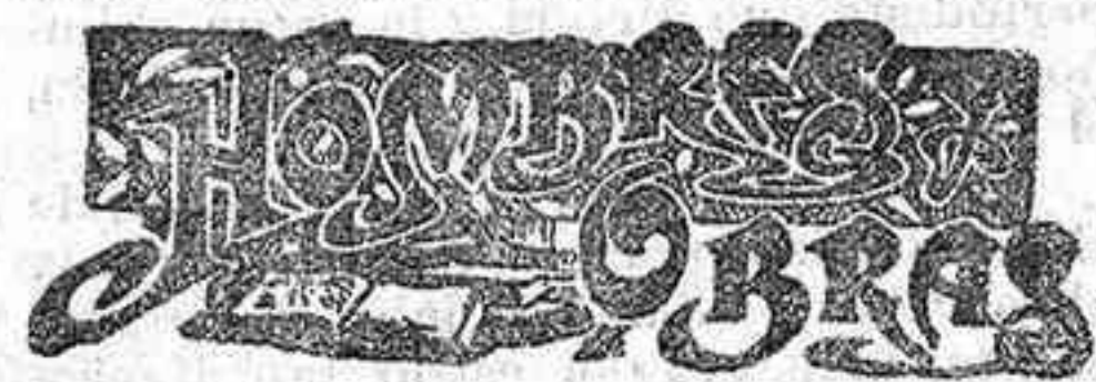
CLAUDIO GASPAR BACHET