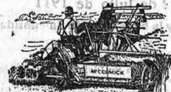
Ríadoras Macormick — ULTIMA PERFECCION —