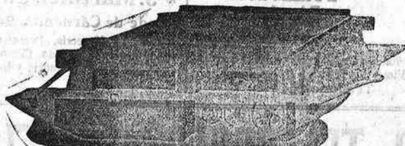
TRILLO ROTATIVO DE GRAN TRABAJO para una sola yunta de mulos.