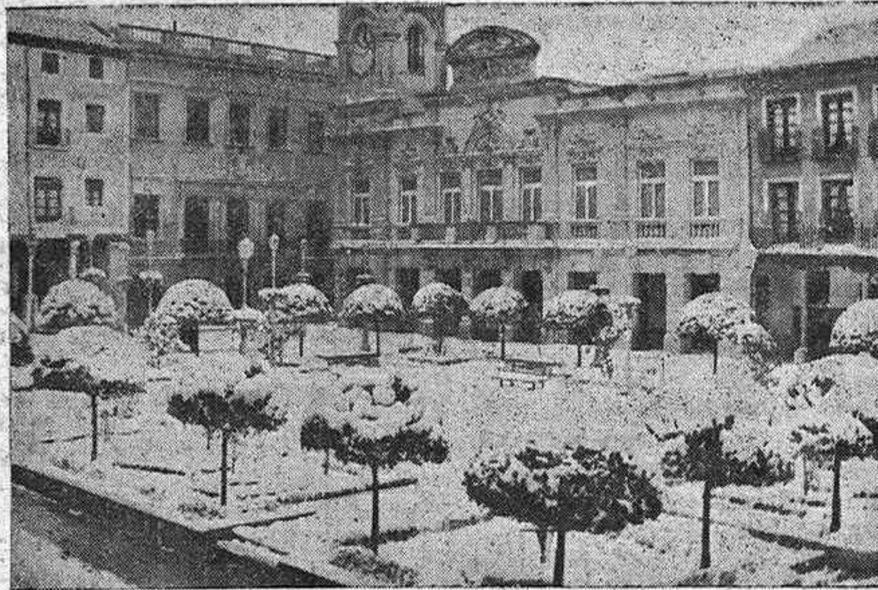
Así estaba la Plaza Mayor a las doce y veinte de la mañana.