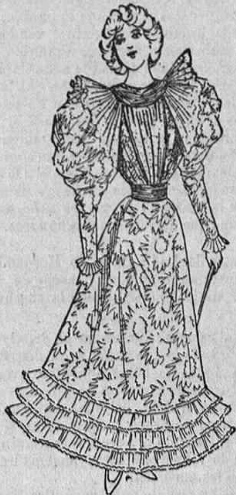
Traje para señorita de 16 años.

Modelos exclusivos para nuestras, de los Grandes Almacenes de EL SIGLO, Barcelona (1)