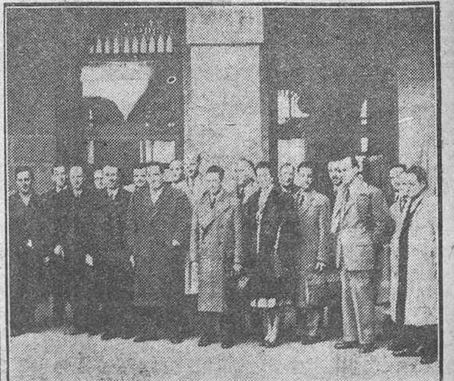
Las delegaciones francesa y española del subcomité de la Comisión Internacional del Pirineo han celebrado una reunión en la Diputación de Pamplona, en la que han llegado a un acuerdo sobre los pastos de Cize (Francia) y Azcoa (Navarra).