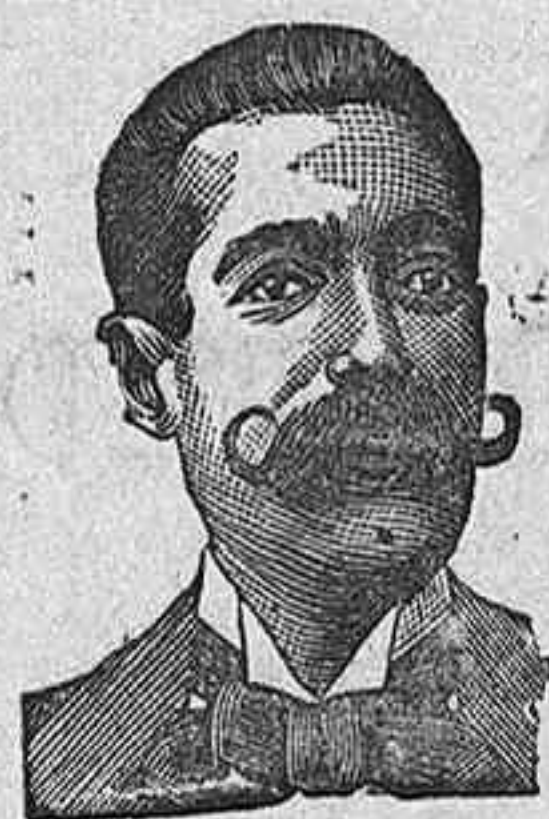
A. SALVATI COSTANZI CALLE DIPUTACION 435 BARCELONA