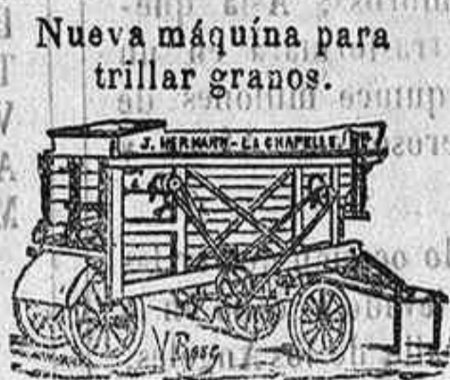
Nueva máquina para trillar granos.

Máquina a vapor y bomba para riego. Nuevos molinos de harina sobre zócalo Boffeei de hierro.