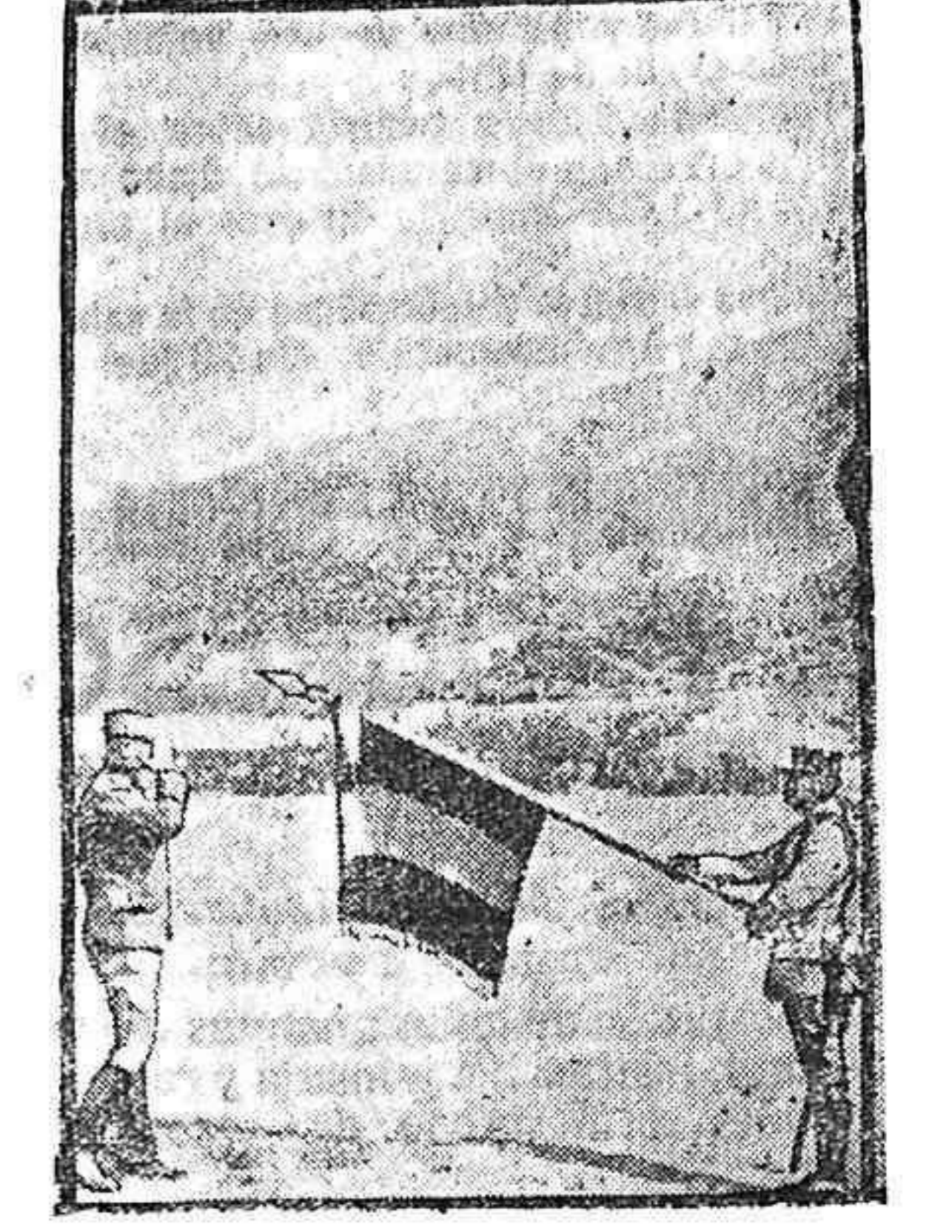
General servio de Macedonia condecorando la bandera del 2.º de zuavos

Entre Gallini y Longara se desenvuelve una lucha encarnizada. Desde el día 10 las pérdidas por los italianos son enormes.