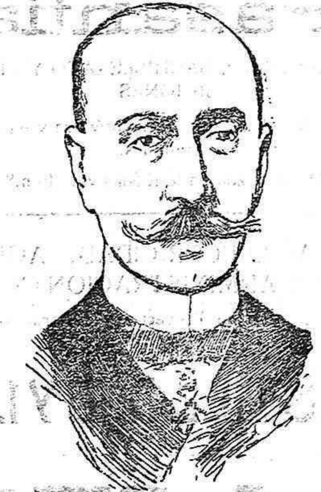
Almirante Couduriotis, que con el ex presidente Venizelos, ha asumido la dirección del movimiento revolucionario de Grecia