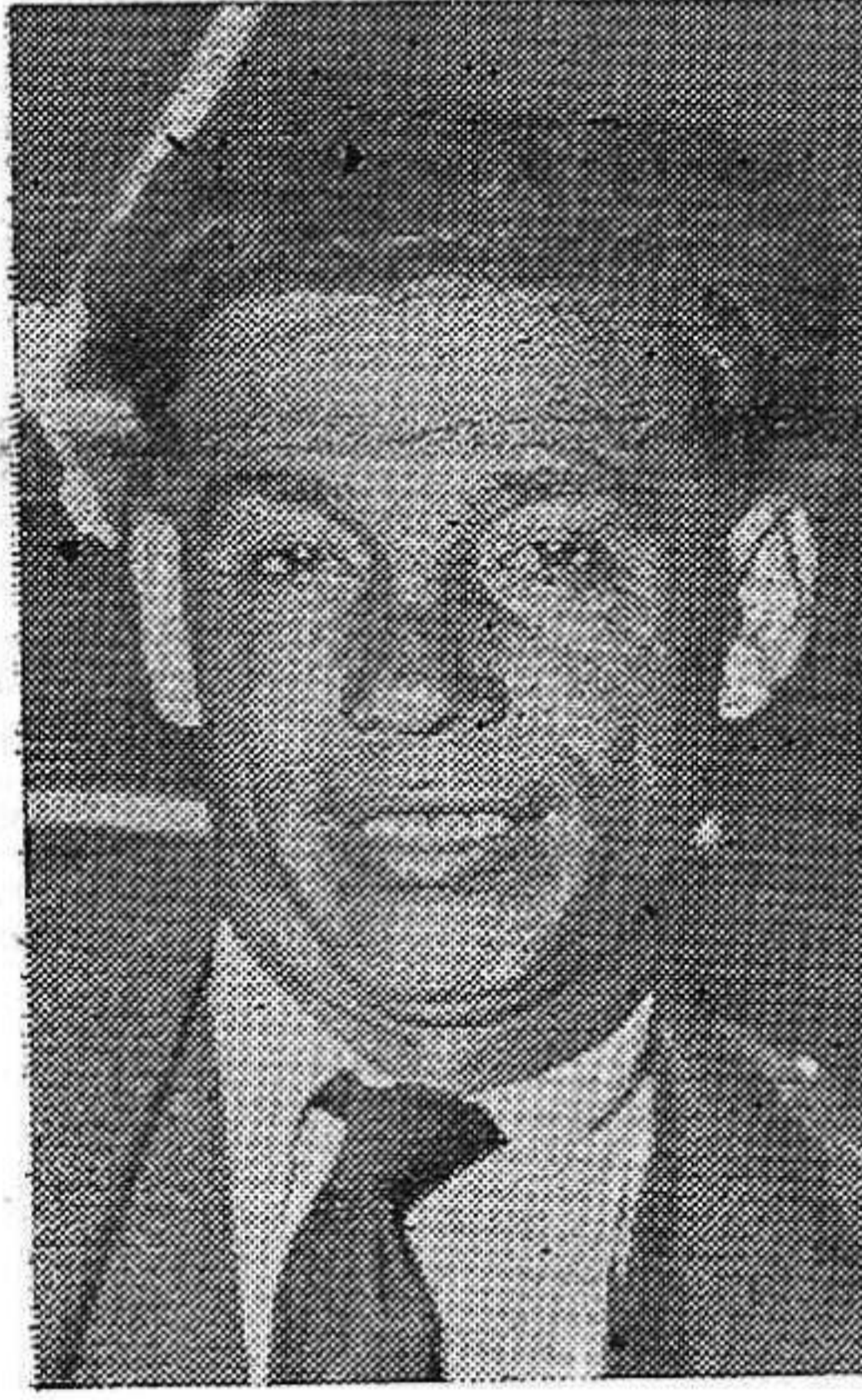
EL esforzado luchador uruguayo que actuó en España