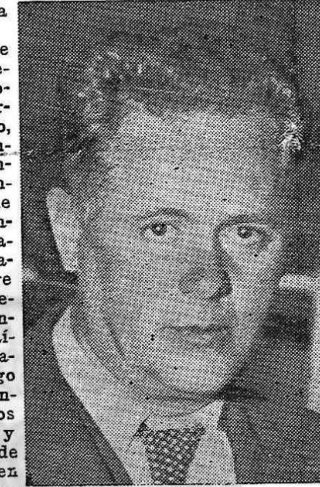
DESTACADO antifascista que también regresó

ser hombres normales, y no prisioneros por el único delito de ser republicanos, para que puedan nuevamente vivir. En ese sentido exhortamos a nuestro pueblo no abandonarla por un instante. Todo esfuerzo que se haga resulta pequeño para ese problema que hace cinco meses existe sin que hasta ahora se le haya podido resolver. Agradeciéndoles sus declaraciones nos despedimos de nuestros compatriotas, no sin antes comprometerlos a colaborar en nuestro periódico y a conversar con más tiempo sobre otros problemas.