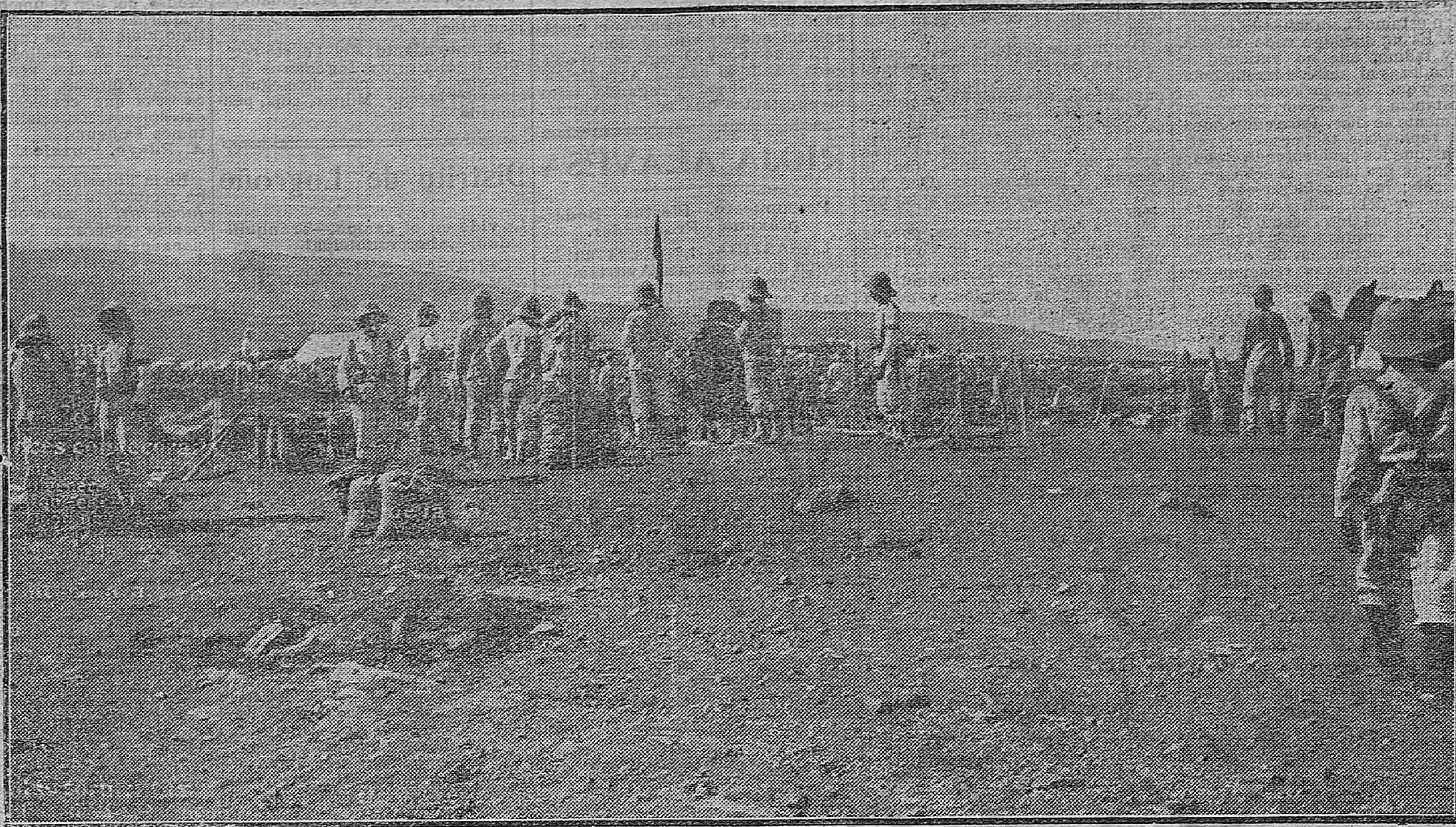
Una de las posiciones ocupadas por nuestras tropas en el Gurugú

Don Joaquín Costa continúa siendo muy visitado en el hotel Peninsular, donde permanecerá pocos días, los necesarios para encontrar alojamiento independiente y próximo al Ateneo, en cuya biblioteca se propone estudiar para una obra importante que prepara. El señor Costa habla con sus amigos de todos los asuntos de actualidad. Condena la política que ha seguido el señor Maura en los términos más duros; dice que ha extremado el castigo en Barcelona, entendiéndose en el trance de una intervención extranjera, basada en los principios de humanidad, y nos ha comprometido a una guerra en el Rif, que es un territorio fanático de su independencia y de su fe, y que, aun en el caso de que los domináramos definitivamente, no bastaría a compensar los sacrificios que estamos realizando. También censuró el empeño de gastar en escuela, para conseguir una costosa apariencia de poder naval, condenando a la vez a la miseria a la enseñanza y a la agricultura, que son necesidades más apremiantes y provechosas. Y contentando a excitaciones de sus amigos, se ha negado resueltamente a ser el caudillo de una fuerza republicana, respecto de la cual se mostró pesimista, porque cree más útil que cada jefe trabaje por su cuenta sin anularse unos a otros.