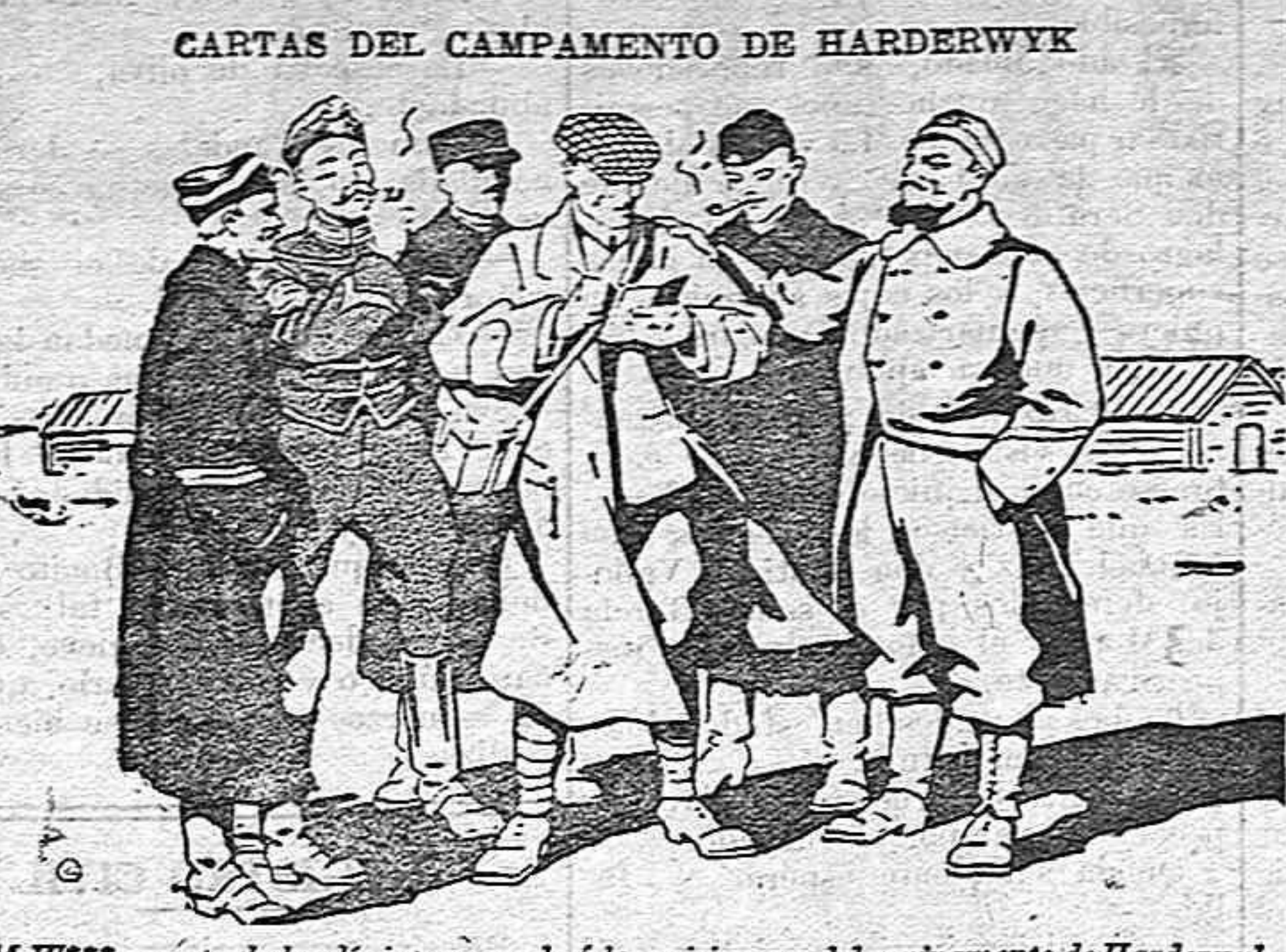
M. W*** reporter holandés interrogando a los prisioneros del campamento de Harderwyk.

CARTAS DEL CAMPAMENTO DE HARDERWYK Sabido es que después de luchar heroicamente contra el invasor, sucumbiendo bajo el número de luchar una contra veinte, algunas tropas belgas evitaron el caer prisioneras pasando la frontera y refugiándose en Holanda.