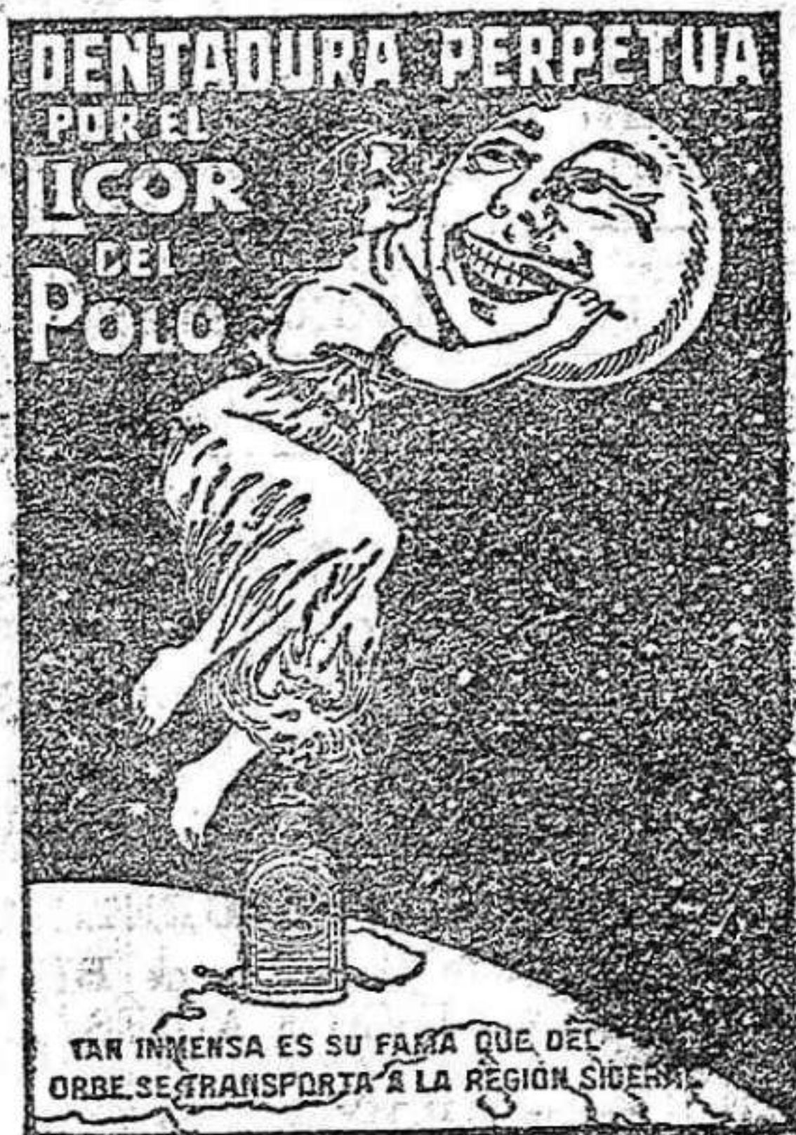
TAN INMENSA ES SU FAMA QUE DEL ORBE SE TRANSPORTA A LA REGION SUDAMERICANA

GRAN ALMACEN "ANGULO" VARA DE REY, NUMERO 10. Logroño