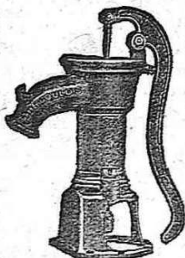
BOMBA PARA RIEGOS

Construye con solidez, economía y adelanto.