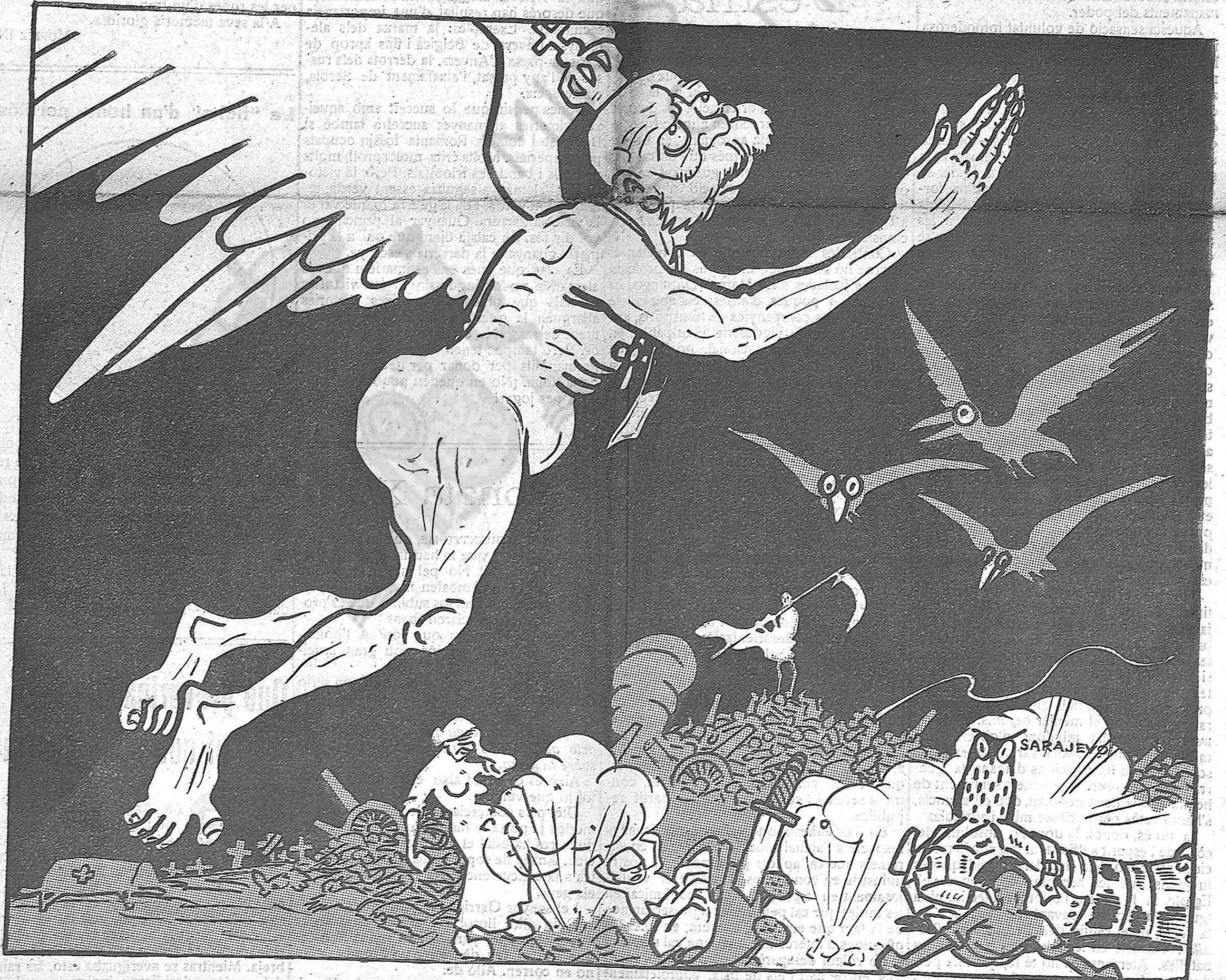
«Angelitos al cielo»