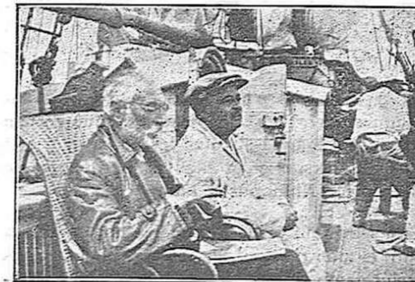
L'Unamuno i en Soriano a bord de l'Aiglon

En els contes de fades es dona notícia de que un príncep s'embarcava en navili d'argent i prou, per a anar a deslliurar a una princesa cautiva en una illa deserta.