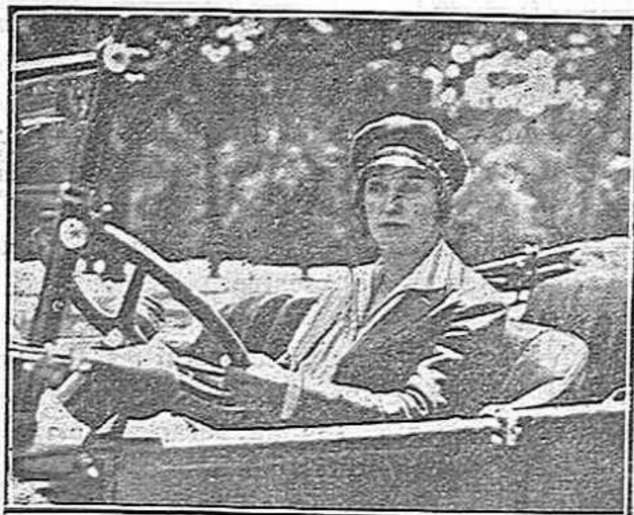
La primera dona xofer.

Un dels problemes que a Espanya haurien d'interessar més i que, en realitat, interessa a ben pocs, és el de la dona. Potser no hi hagi altre país