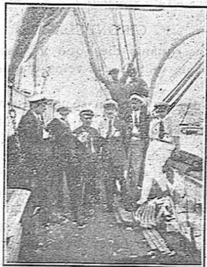
El pont de l'Aiglon.

Nietzsche, no sé si en Menschliches, allzumenschliches —però crec que sí—diu que la dona és, intel·lectualment, superior a l'home. No recordo en